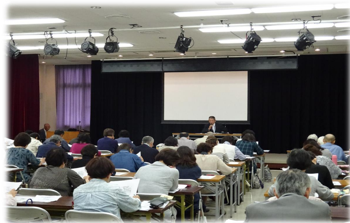
枚方市生活支援員養成研修の様子

❖申込受付期間❖令和3年2月1日（月）～2月17日（水） 先着120名 ※ ☎での受付は平日の9：00～17：00、faxは24時間受付可