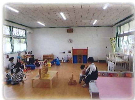
お部屋には赤ちゃんコーナーや おままごと、木の電車などがあります