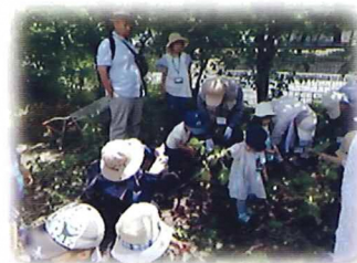
みんなで育てた じゃがいもを収穫中

ファミリーポートひらかたの様子は 開室日にインスタグラム・アメブロ・ Facebook でアップしています。