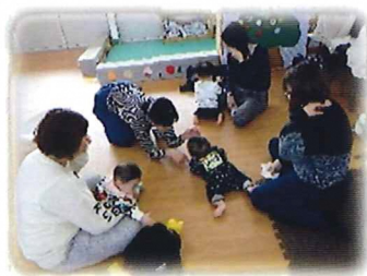
ママと赤ちゃんのプログラム

0～3歳の子どもと親が気軽に遊びに来られる場所です。 自由に遊べる広場、プログラムをやっています。(予約制) 赤ちゃん向けのプログラムでは同月齢の子どもを育てる仲間との出 会いもあります。 詳しくはホームページやインスタグラムをご覧ください。