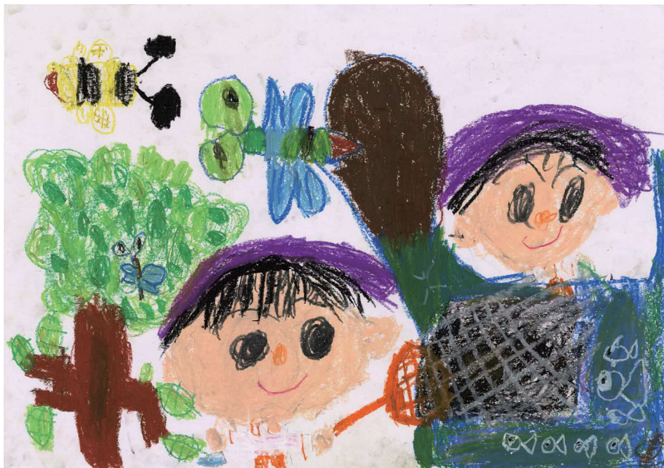
市内保育所（園）に通う5歳児の絵