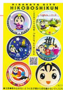
▲ひこぼしくんの ぷっくりシール