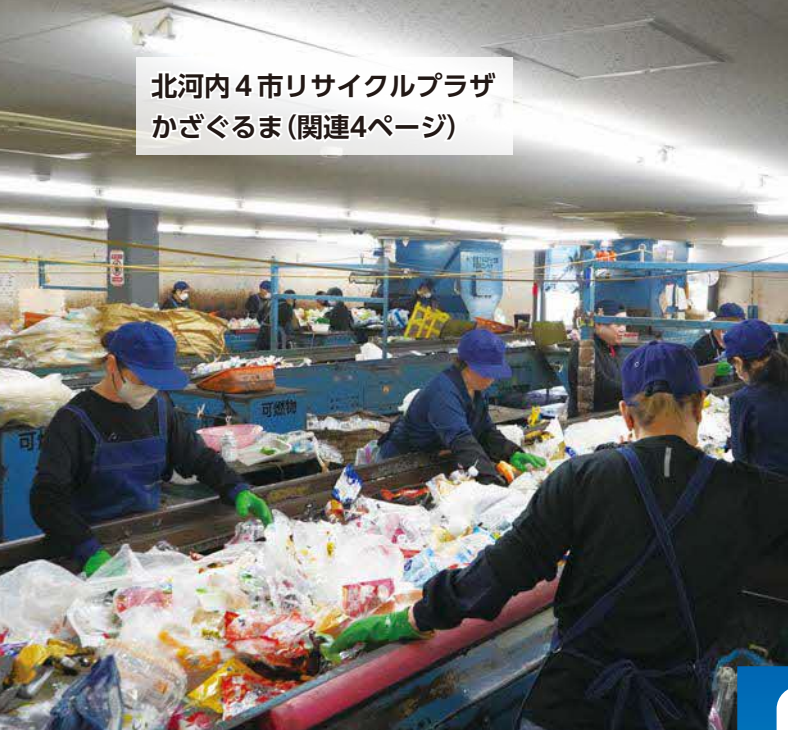
北河内4市リサイクルプラザ かざぐるま(関連4ページ)