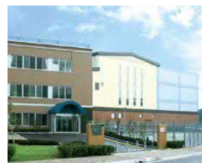
所在地 寝屋川市寝屋南1-7-1