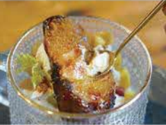
誰もがハマるブリュレ