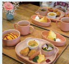
お子様ランチ【要予約】

カフェは住宅の1階を改装した落ち着いた空間で、カウンター席とテーブル席があり、ゆっくり過ごしたい人にぴったり! インテリアや食器にもこだわりがあり、訪れるだけで特別感のある時間が過ごせます。