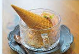
絶品のソフトクリーム