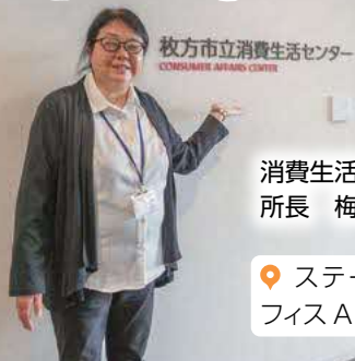
枚方市立消費生活センター CONSUMER AFFAIRS CENTER