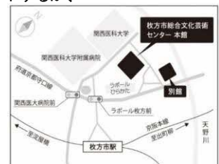
◎京阪電車「枚方市」駅から徒歩約5分