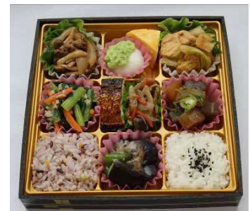
▲枚方の恵みくらわんか弁当

★トップワールドは大阪北東地域で展開する自然派スーパーマーケットで、「自然なおいしさを追求し、健やかな人と社会づくりに貢献する」を経営理念とし、安全・安心な食材、身体に優しい食文化の提供をモットーに活動している。店内で販売される農産物には、産地や生産者を表示し、生産者にこだわった野菜を販売しているほか、生産者の農地で野菜の収穫体験を開催するなど地元の農や野菜に触れられる機会を提供している。