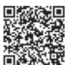
▲食育ポータル サイト

食の楽しさや大切さを学べる参加 型イベントが盛りだくさん。イベン トに参加して応募すると抽選で枚方 産の野菜や米、調理家電、ひらかた ポイントなどが当たります。各イベ ントの申し込み方法や詳細は食育ポ ータルサイト「ひらかた食育の環」(上記コード)参照。 同サイトでは食育に関するクイズや動画、レシピ、食 育の取り組み紹介などのコンテンツも。