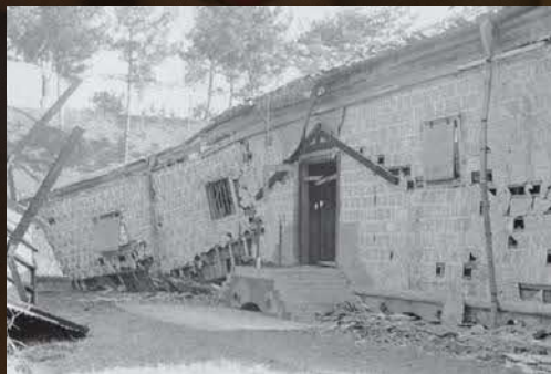
▲爆発で崩れた禁野火薬庫倉庫

戦前の枚方は、砲弾などを格納する禁野火薬庫や、それらを製造する枚方製造所、香里製造所などがある「軍需のまち」でした。昭和14年3月1日午後2時45分、禁野火薬庫で解体していた砲弾が発火し爆発。次々と火薬に引火し、29回の爆発を繰り返しました。火災は約3日間続き、死傷者約700人、被災世帯は4400世帯を超え、市最大の戦争被害となりました。また、昭和29年には同じ3月1日に第五福竜丸がビキニ環礁で米軍の水爆実験により被ばく。これらのことから、市は平成元年に3月1日を市民一人一人が平和を願う日として「枚方市平和の日」に制定し、毎年この時期に平和記念事業を開催しています。