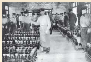
▲禁野火薬庫内部の様子