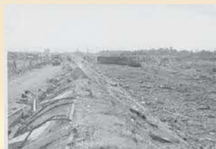
▲爆発後の火薬庫一帯