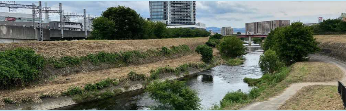
天津橋の上流を望む

今後、全6回程度のワークショップを行い、天野川のさらなる活用に向けたアイデアや提案をいただきます。