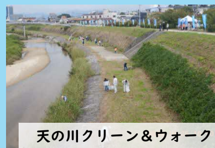
天の川クリーン&ウォーク