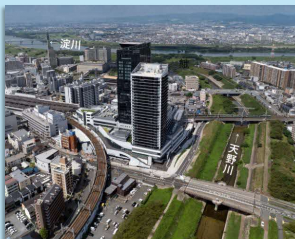
天野川と新たな都市機能 (ステーションヒル枚方)

枚方市では、再開発などによる「まち」の魅力を高める新しい施設と、既に地域にある自然や文化・歴史などの資源を繋ぐことで、居心地が良く、歩いて楽しいウォカブルなまちづくり(枚方市駅周辺再整備)に取り組んでいます。