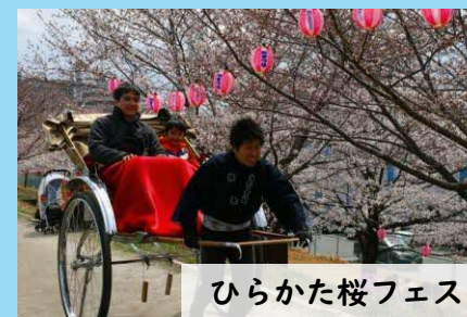
ひらかた桜フェス