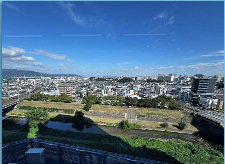
会議室から望む天野川