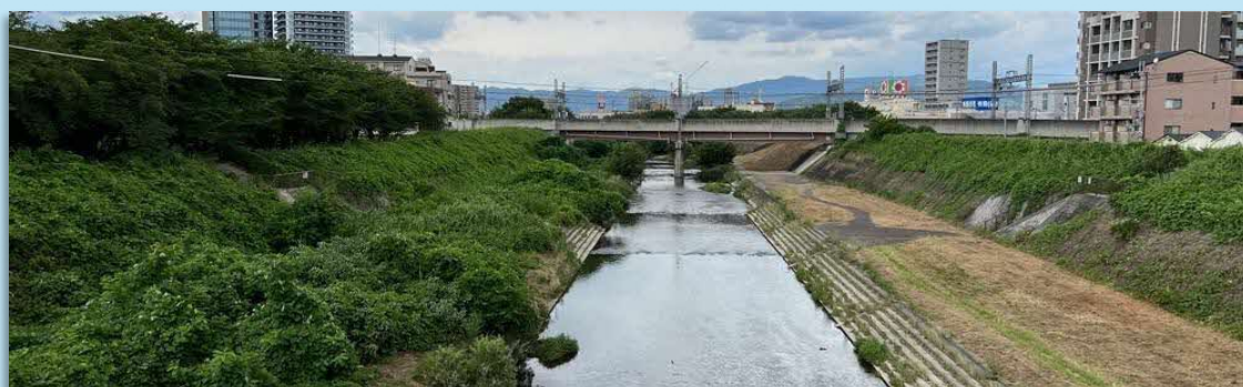
禁野橋から天野川下流を望む

今年度からは、重要な地域資源である天野川をさらに活かして、まち全体のにぎわいの創出や回遊性の向上を図るために、地域における「かわ」を活用したまちづくりを河川管理者が支援する「かわまちづくり支援制度」などの活用も見据えて、関係者と連携し、検討を進めています。