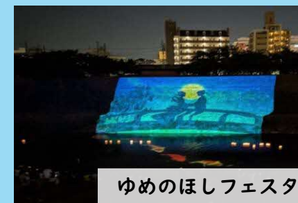
ゆめのほしフェスタ