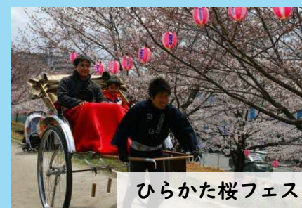
ひらかた桜フェス