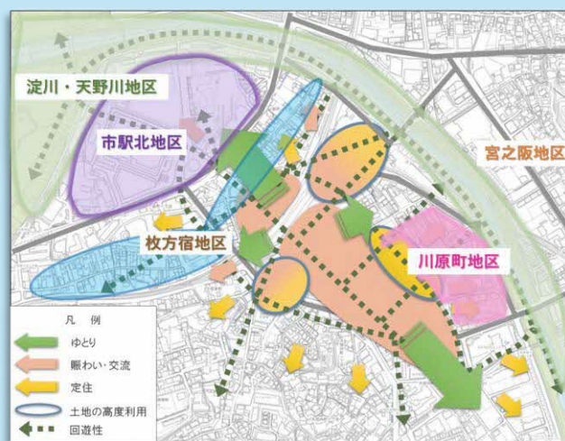
周辺価値向上のイメージ 枚方市駅周辺再整備基本計画より

今年度からは、重要な地域資源である天野川をさらに活かして、まち全体のにぎわいの創出や回遊性の向上を図るために、地域における「かわ」を活用したまちづくりを河川管理者が支援する「かわまちづくり支援制度」などの活用も見据えて、関係者と連携し、検討を進めています。