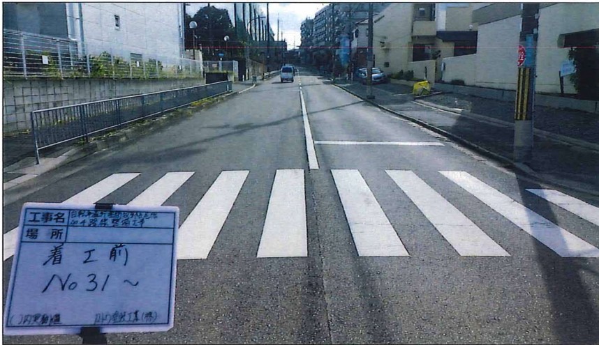
写真区分: 着工前及び完成写真(道路2) 写真タイトル: 着工前 撮影箇所: No31~