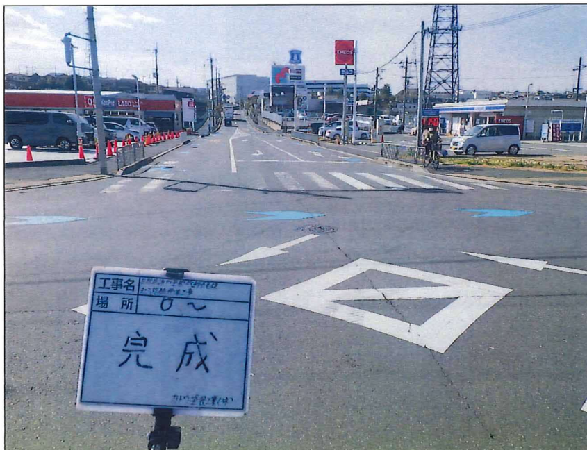
写真区分: 着工前及び完成写真(道路2) 写真タイトル: 完成