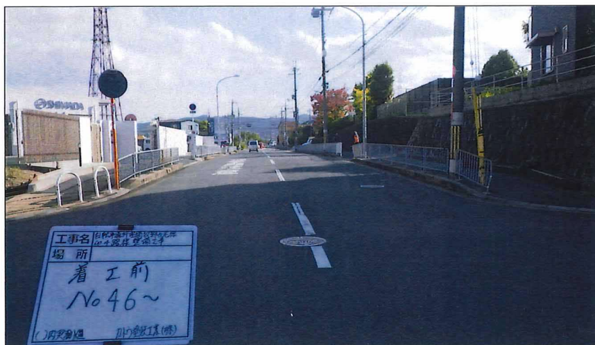
写真区分:着工前及び完成写真(道路2) 写真タイトル:着工前 撮影箇所:No46~