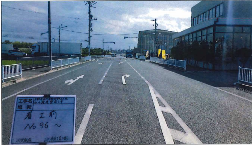
写真区分: 着工前及び完成写真(道路) 写真タイトル: 着工前