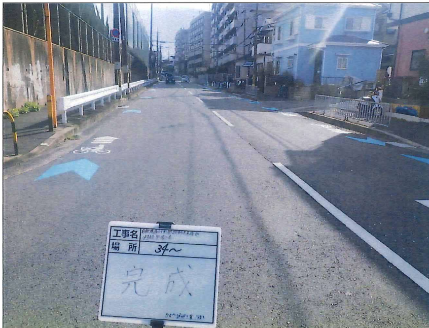
写真区分:着工前及び完成写真(道路2) 写真タイトル:完成 撮影箇所:No34~