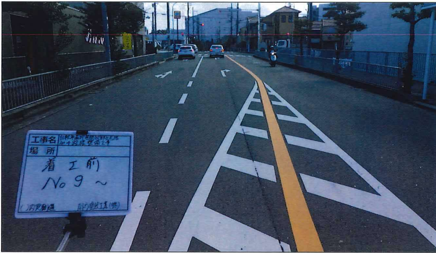
写真区分: 着工前及び完成写真(道路2) 写真タイトル: 着工前 撮影箇所: No9~