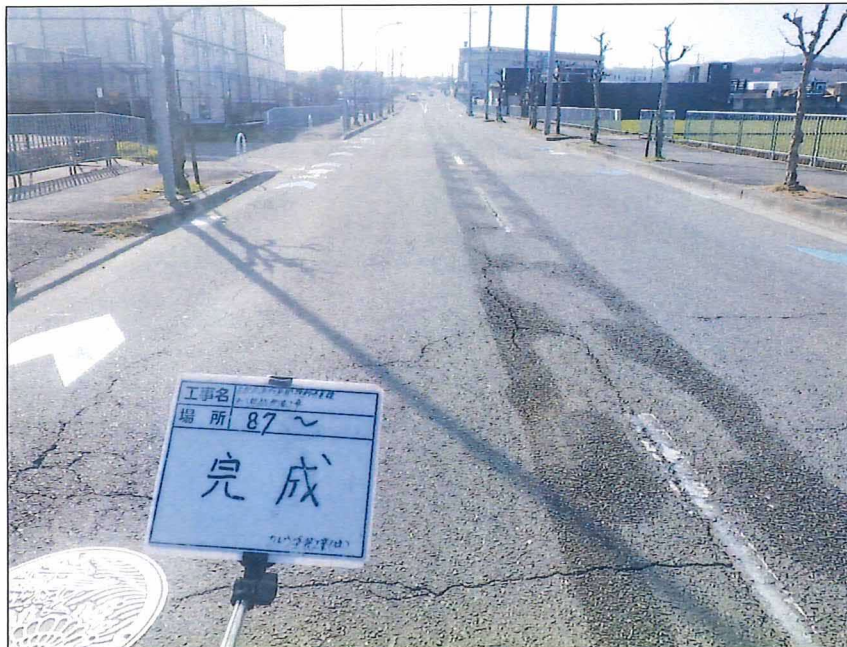
写真区分: 着工前及び完成写真(道路) 写真タイトル: 完成 撮影箇所: No.87~