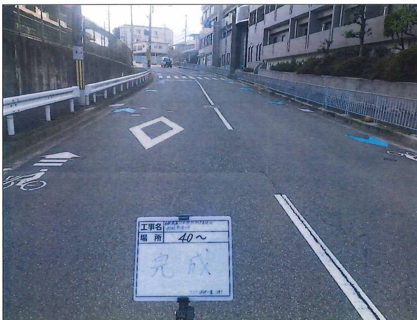
写真区分: 着工前及び完成写真(道路2) 写真タイトル: 完成 撮影箇所: No40~