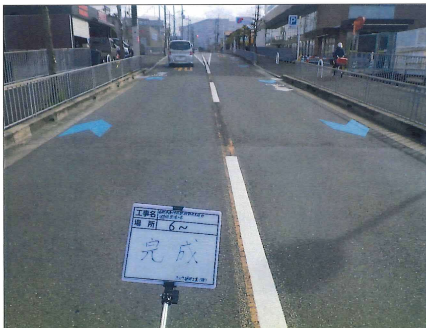
写真区分:着工前及び完成写真(道路2) 写真タイトル:完成 撮影箇所:No6~