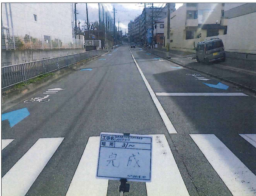
写真区分: 着工前及び完成写真(道路2) 写真タイトル: 完成 撮影箇所: No31~