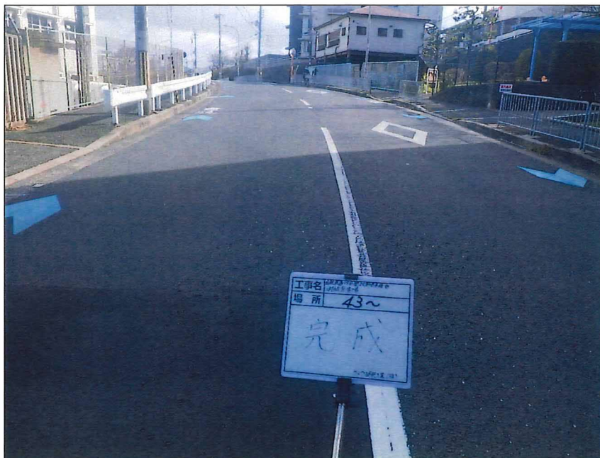
写真区分:着工前及び完成写真(道路2) 写真タイトル:完成 撮影箇所:No43~