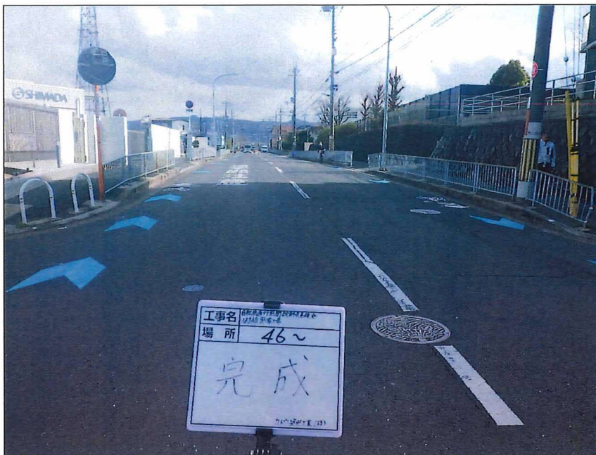
写真区分:着工前及び完成写真(道路2) 写真タイトル:完成 撮影箇所:No46~