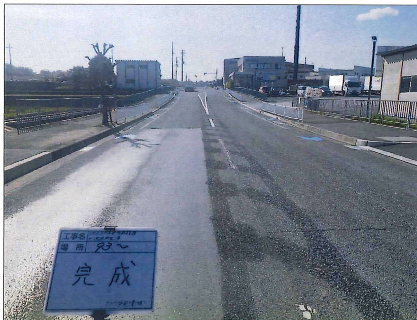
写真区分:着工前及び完成写 真(道路) 写真タイトル:完成 撮影箇所:No93~