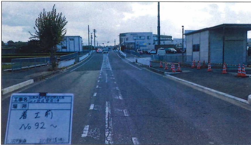
写真区分:着工前及び完成写 真(道路) 写真タイトル:着工前 撮影箇所:No93~