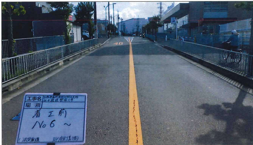
写真区分:着工前及び完成写真(道路2) 写真タイトル:着工前 撮影箇所:No6~