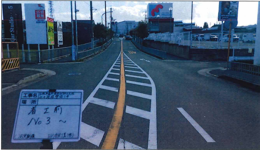
写真区分: 着工前及び完成写真(道路2) 写真タイトル: 着工前 撮影箇所: No3~