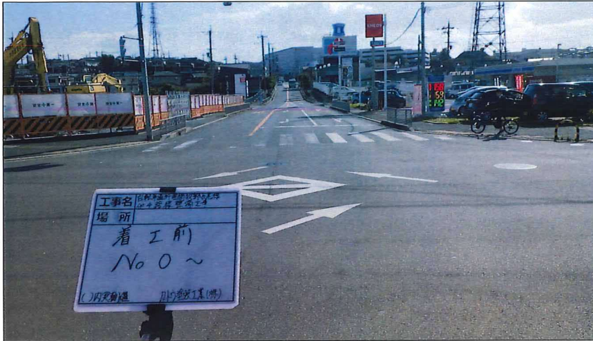
写真区分: 着工前及び完成写真(道路2) 写真タイトル: 着工前 撮影箇所: No0~