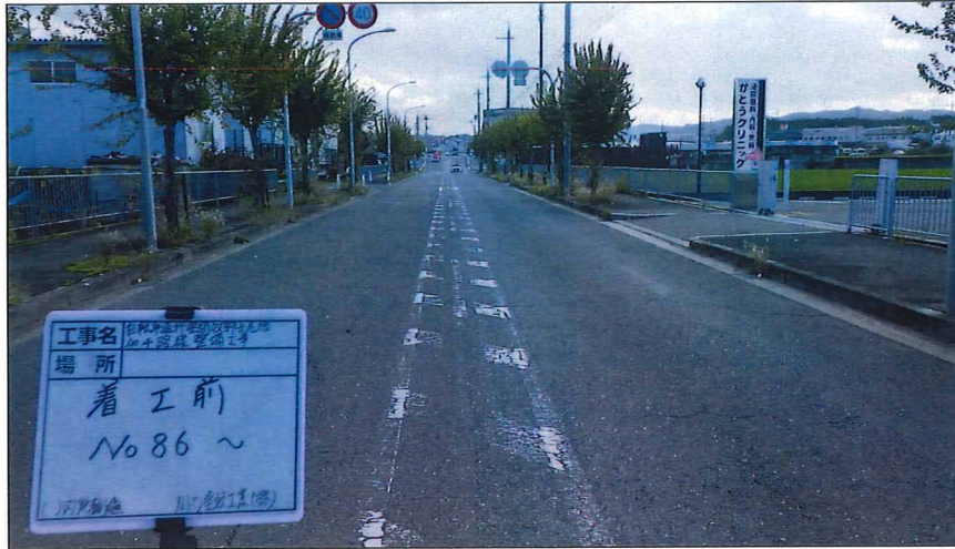
写真区分: 着工前及び完成写真(道路) 写真タイトル: 着工前