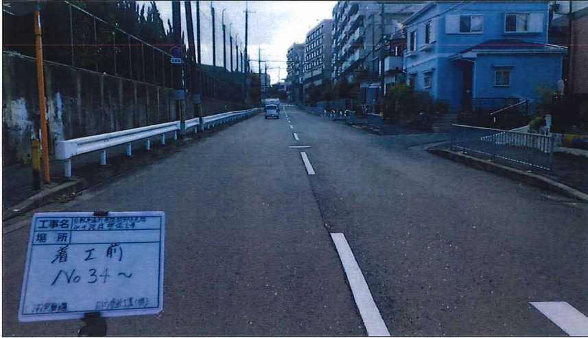
写真区分:着工前及び完成写真(道路2) 写真タイトル:着工前 撮影箇所:No34~