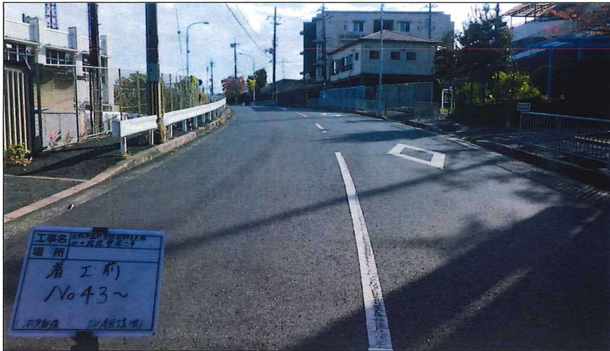
写真区分:着工前及び完成写真(道路2) 写真タイトル:着工前 撮影箇所:No43~