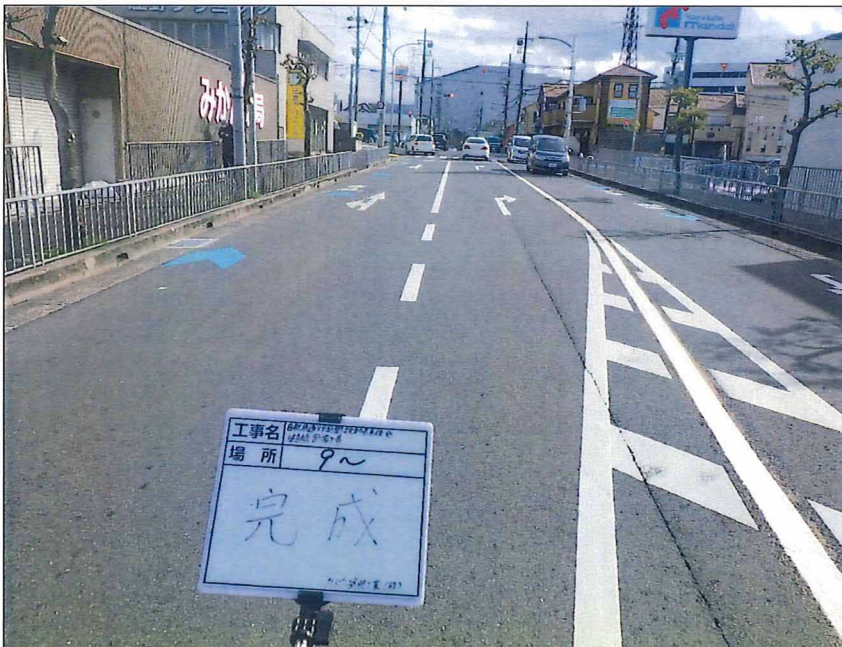
写真区分: 着工前及び完成写真(道路2) 写真タイトル: 完成 撮影箇所: No9~