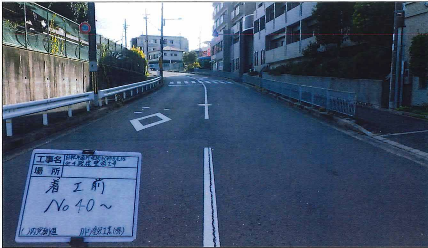
写真区分: 着工前及び完成写真(道路2) 写真タイトル: 着工前 撮影箇所: No40~