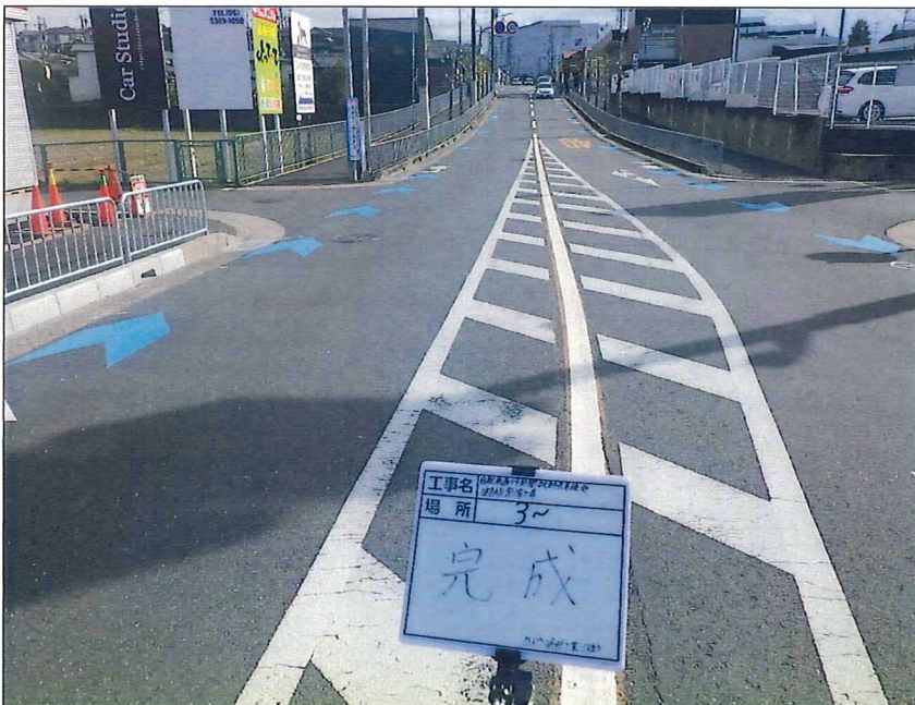
写真区分: 着工前及び完成写真(道路2) 写真タイトル: 完成 撮影箇所: No3~