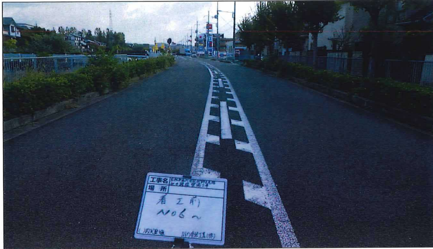
写真区分: 着工前及び完成写真(道路) 写真タイトル: 着工前 撮影箇所: No6~