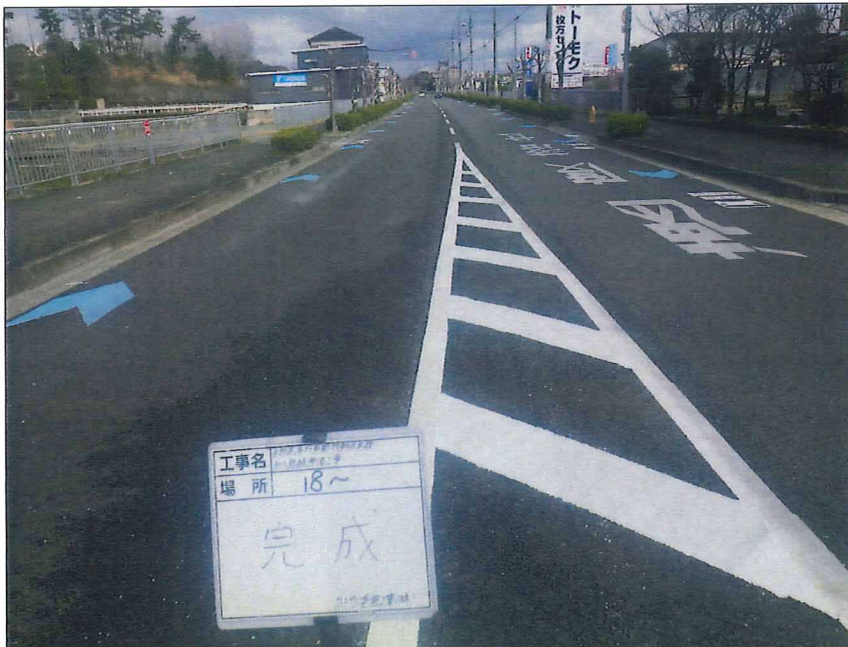
写真区分:着工前及び完成写真(道路) 写真タイトル:完成 撮影箇所:No18~