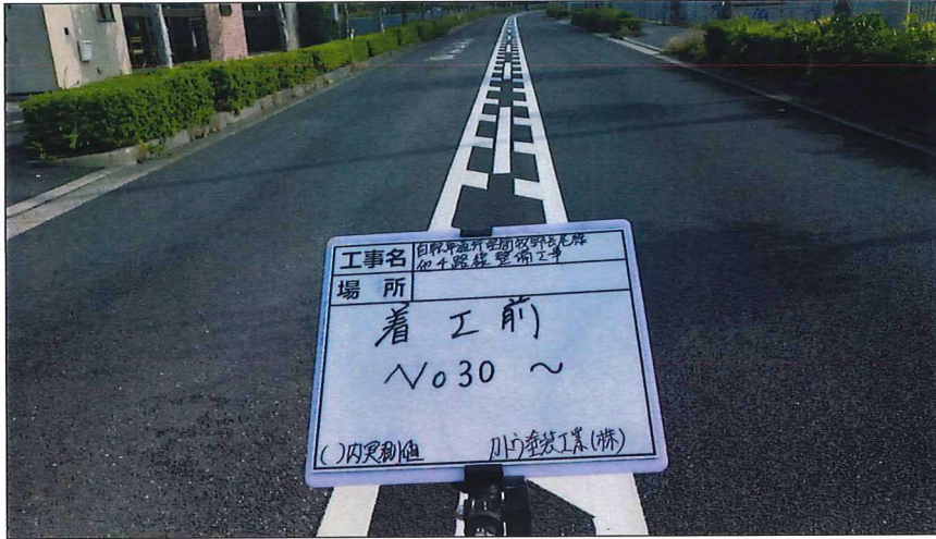
写真区分: 着工前及び完成写真(道路) 写真タイトル: 着工前 撮影箇所: No30~