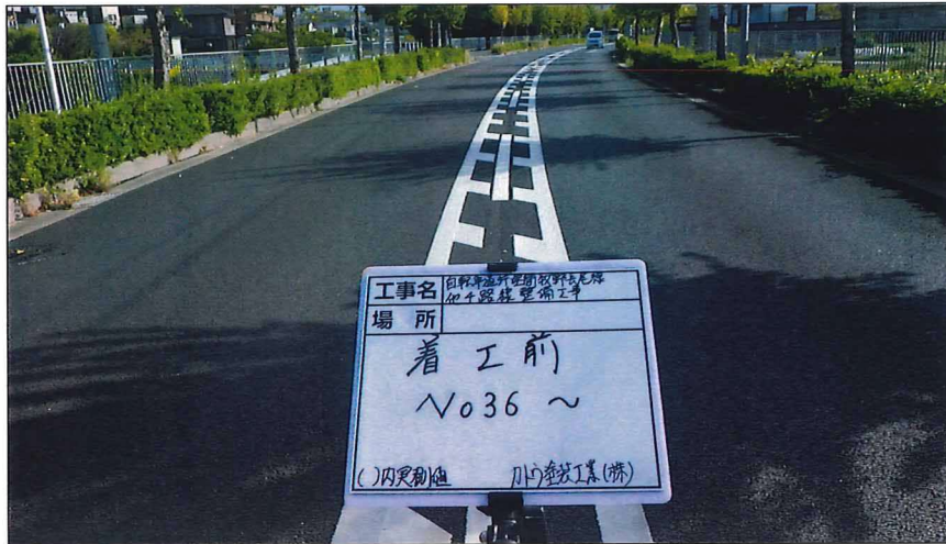
写真区分: 着工前及び完成写 真(道路) 写真タイトル: 着工前 撮影箇所: No36～