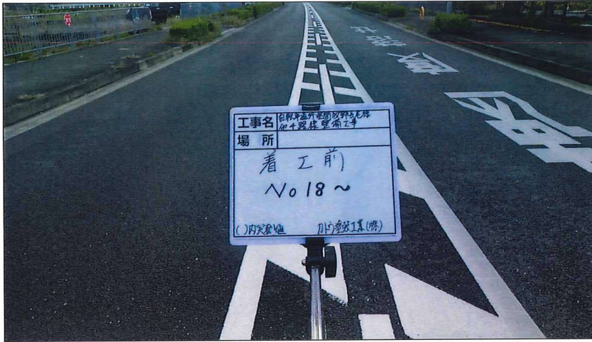
写真区分:着工前及び完成写真(道路) 写真タイトル:着工前 撮影箇所:No18~