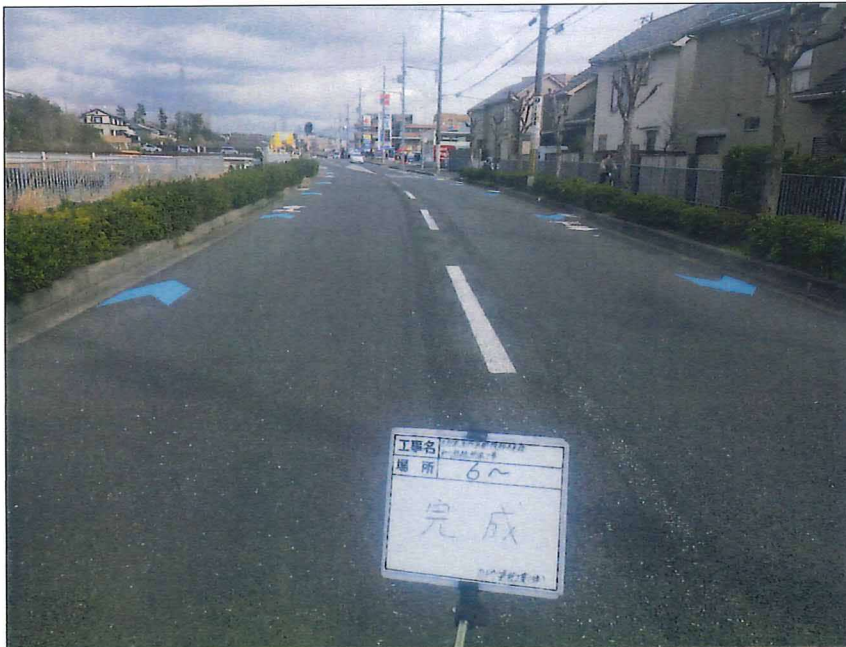
写真区分: 着工前及び完成写真(道路) 写真タイトル: 完成 撮影箇所: No6~