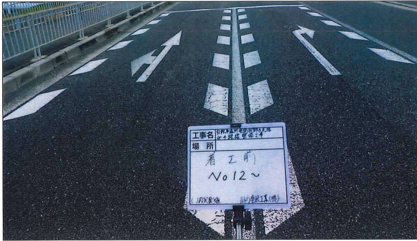
写真区分: 着工前及び完成写真(道路) 写真タイトル: 着工前 撮影箇所: No12~