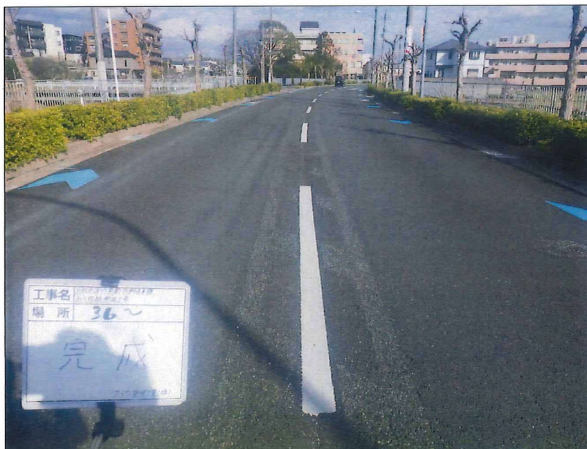
写真区分: 着工前及び完成写 真(道路) 写真タイトル: 完成 撮影箇所: No36～