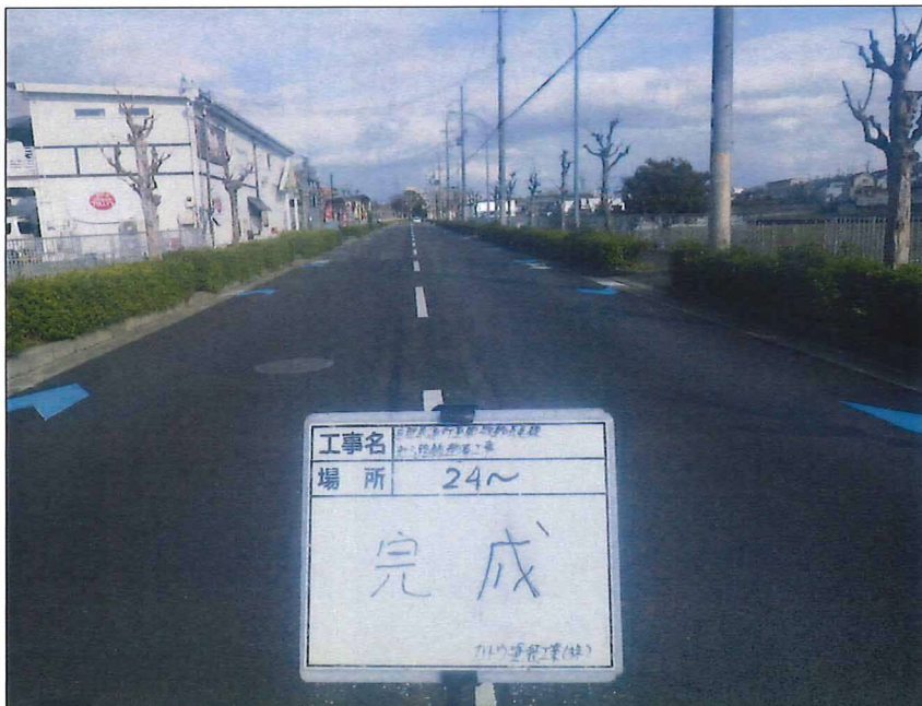
写真区分: 着工前及び完成写真(道路) 写真タイトル: 完成 撮影箇所: No24