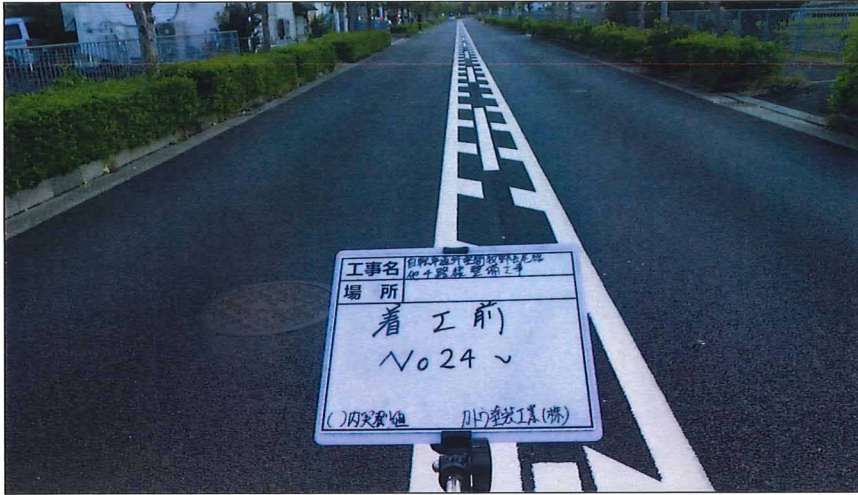
写真区分: 着工前及び完成写真(道路) 写真タイトル: 着工前 撮影箇所: No24~