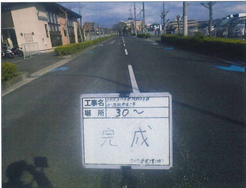
写真区分: 着工前及び完成写真(道路) 写真タイトル: 完成 撮影箇所: No30~