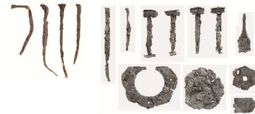
写真 指定候補金属製品の一部遺物 ※飾金具・押出仏は別添

例) 鉄釘については頭部の形態ごとに良好なものを選別、その他(飾金具除く)の金属製品については種類ごとに良好なものを選別