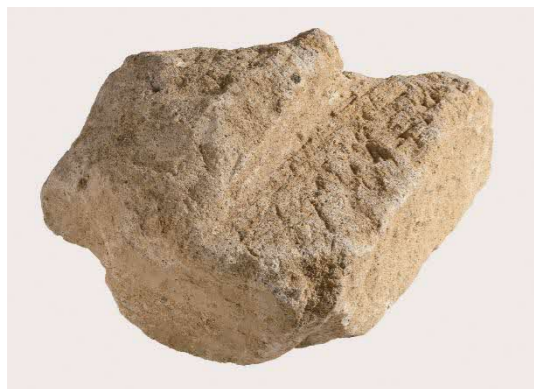
例) 道具痕が残り基壇外装(壇正積)の根拠となった地覆石片を選別