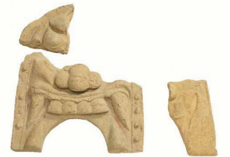
写真 指定候補道具瓦の一部

・塼仏・・・・・・・・・・・・・・・・・・・・・・・・108点(府指定文化財指定済)