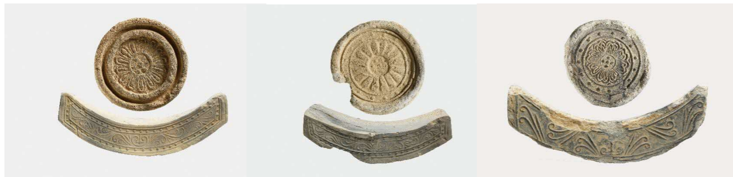
写真 指定候補軒丸瓦・軒平瓦の一部