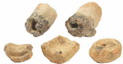
写真 指定候補冶金関連遺物 例) 鑄羽口、鑄型から良好なものを選別