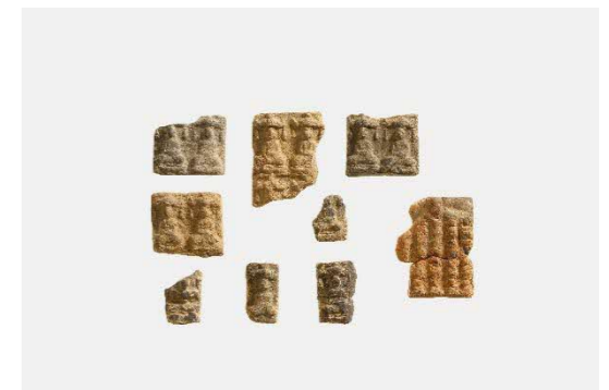
参考写真 指定候補塼仏の一部