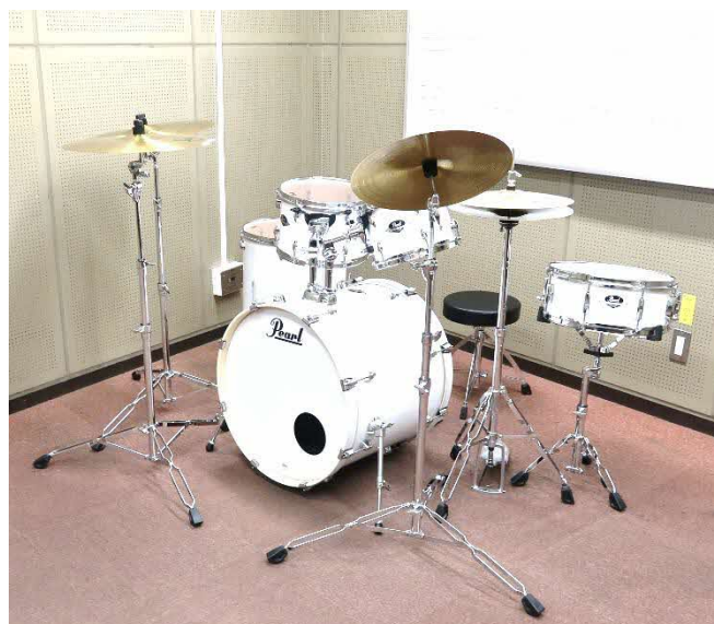
高校生から要望が多かった4シンバルになりました