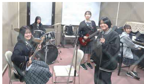
Pigeonさん、ご協力ありがとうございました。

青少年センターでは、様々な機材やセットを無料で借りられるので、とてもありがたいです。