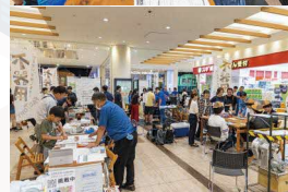
不器用 FACTORY2024 の様子