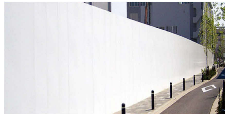
フラットパネル 高さ 3.0m