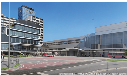
拡張整備後の市駅北側ロータリー