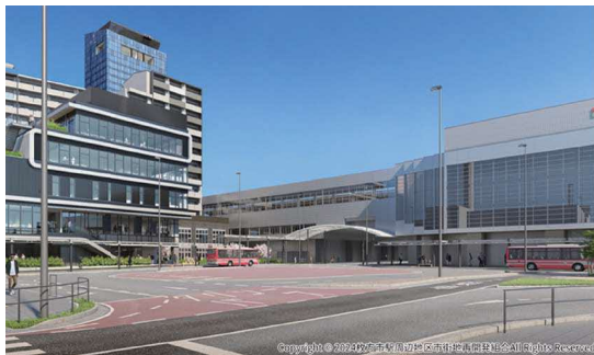
Copyright © 2022 枚方市駅周辺地区市街地再開発組合 All Rights Reserved.