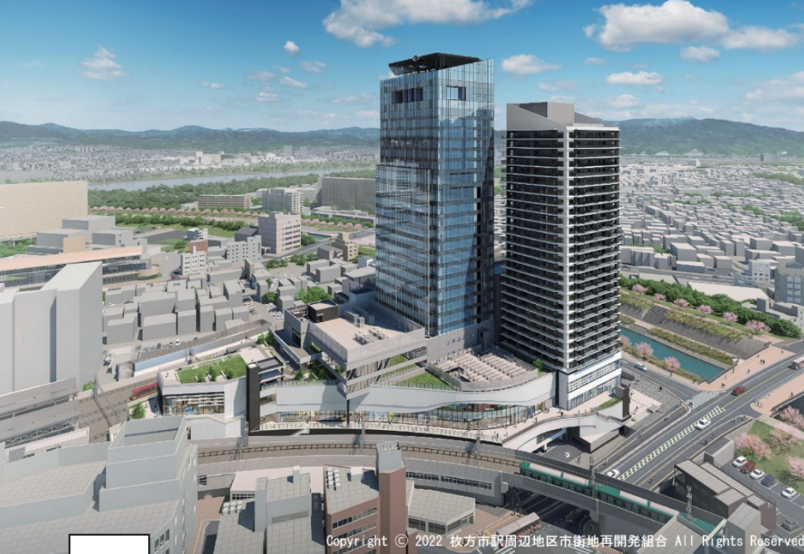
Copyright © 2022 枚方市駅周辺地区市街地再開発組合 All Rights Reserved.