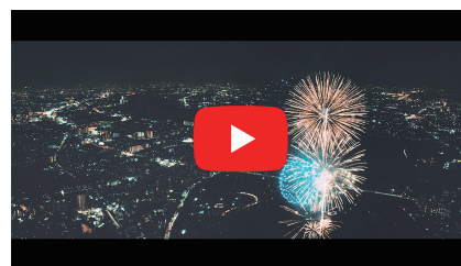
枚方でオールロケ。花火大会の映像も必見。