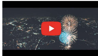
枚方でオールロケ。花火大会の映像も必見。