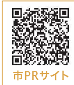
20歳～44歳の夫婦世帯に枚方が選ばれています