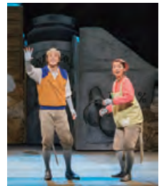
※これまでの公演より撮影：堀勝志古

ネズミのガンバと仲間たちの冒険ものがたり。全国各地で上演された人気ミュージカル。▶日時など 8月3日(土)午後4時、関西医大 大ホール。▶チケット S席6000円(3歳~小学生4000円)、A席4000円(3歳~小学生3000円)。全席指定。3歳未満膝上鑑賞無料。下記チケット販売場所A~Cで発売。(※) 発売日注意。