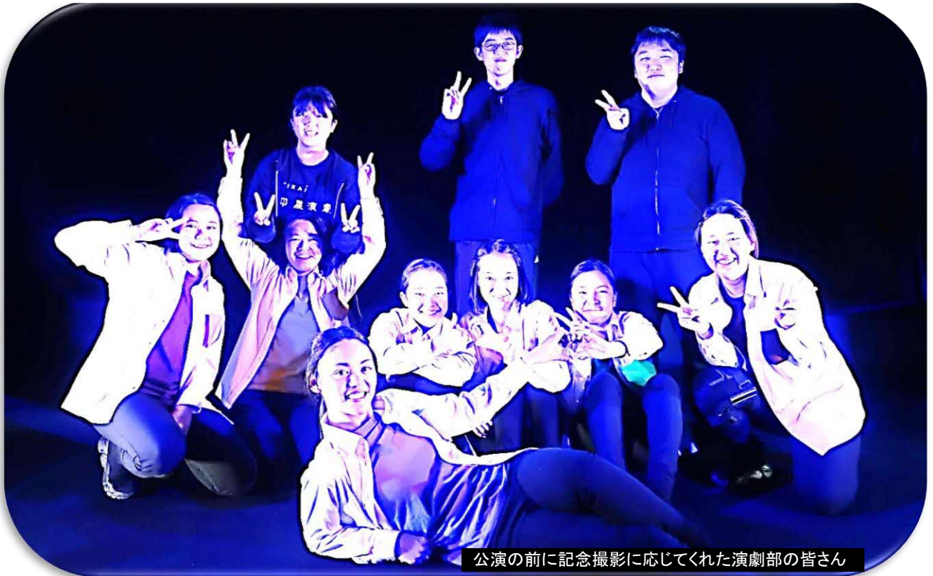
公演の前に記念撮影に応じてくれた演劇部の皆さん

センターだよりの名称：中学生や高校生がやってみたいことを創り上げる場所として工場（FACTORY）をイメージしています。