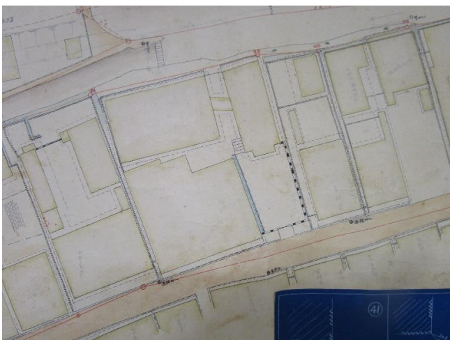
枚方町一部平面図 ※2 (1/300 縮尺測量図、昭和3年8月作成)