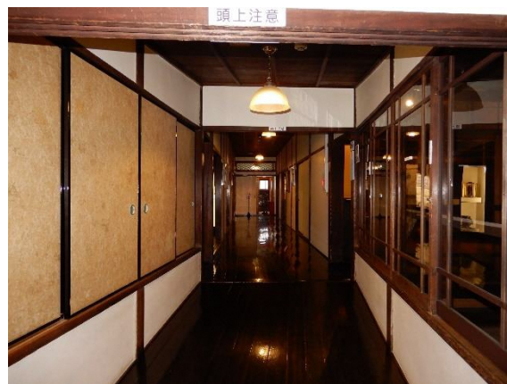
内観（1階渡り廊下と中廊下）