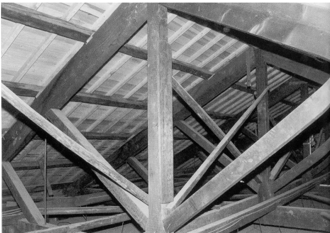
西棟小屋裏 トラス組と棟札 ※1

昭和参年四月十一日 監督□□□ 大工亀谷忠幸 手傳長谷川孫一郎 左官村上□三郎 上棟式 吉川宗次郎請負人木□□ 木挽西川長太郎 手傳溝口末吉 左官□本職定 監督□□□□ 土工東口幸三郎 石工豆野長次郎 瓦屋西田藤次郎