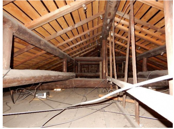
東棟小屋裏 小屋組