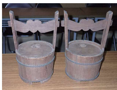
ハナタテに置くキオケ