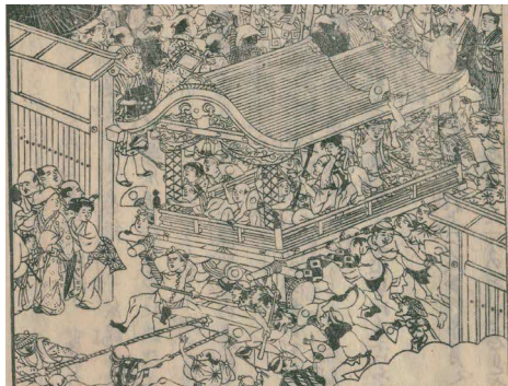
【参考】『摂津名所図会』のだんじり

釈尊寺の旧村は小さな集落であるにもかかわらず、明治中期にだんじりを購入したことは興味深く、その経緯が明らかになれば、当時の地域経済、人々のだんじりや祭りへの思いや考え方が