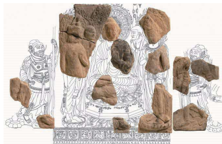
大型多尊博仏 (下絵は『夏見廃寺報告書』より)

また、枚方市・交野市に所在する「交野節」が府無形民俗文化財(記録選択)に選択されました。