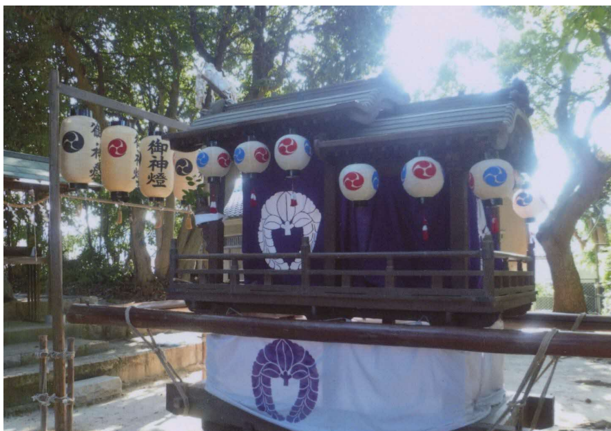
祭りの日の釈尊寺町のだんじり（2015年ごろ）