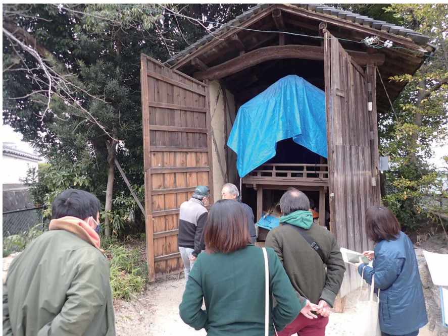
小屋に納められただんじり

だんじりというと、岸和田市のだんじりが全国的に有名ですが、枚方にもだんじりを持っている地域があります。岸和田のだんじりのように走ることはありませんが、地域の秋祭りで、ゆっくり、堂々と曳かれています。だんじりの中には太鼓があり、叩いて鳴らすために人も乗り込みます。神輿と混同されることもありますが、神輿は神さまの乗り物とされているので、人は乗りません。だんじりは、本来は、お祭りを賑やかにするために町や村の人たちが出すアトラクションのようなものでした。