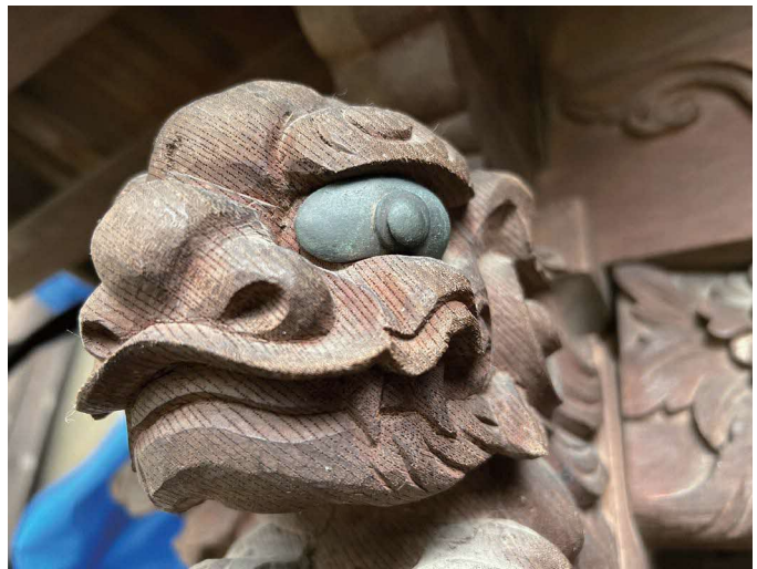
金属製の目の木鼻の獅子