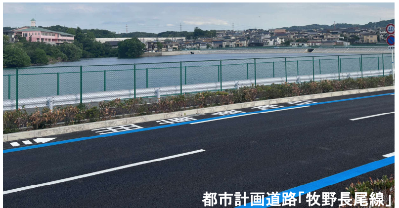
都市計画道路「牧野長尾線」