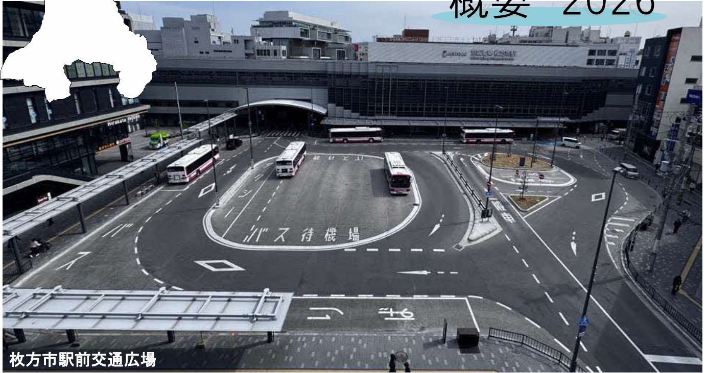
枚方市駅前交通広場