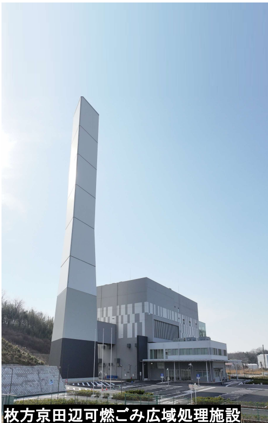
枚方京田辺可燃ごみ広域処理施設