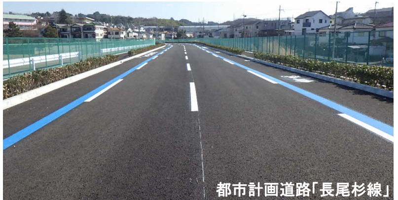
都市計画道路「長尾杉線」