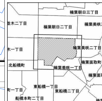
楠葉朝日一丁目 概見図