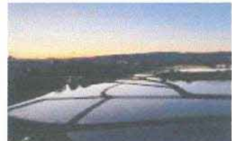
2024年撮影（招堤地区田園風景）