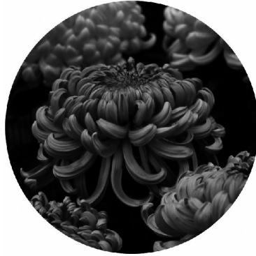
市の花「菊」 (昭和42年10月15日制定)