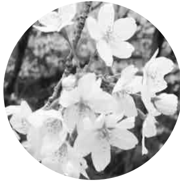
市の花「桜」 (平成19年2月9日制定)