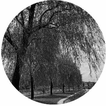
市の木「柳」 (昭和42年10月15日制定)