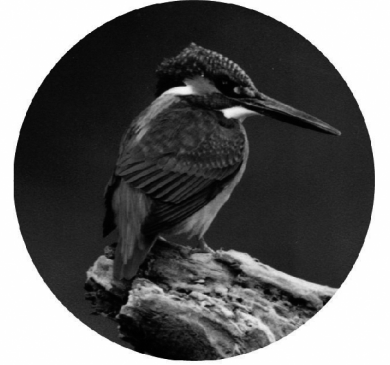
市の鳥「カワセミ」 (平成14年8月1日制定)