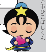
枚方市ひこぼしくん