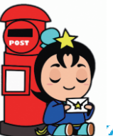
枚方市ひこぼしくん

枚方市役所いじめ相談窓口では、手紙でいじめの相談ができます。あなたのお話を聞かせてください。