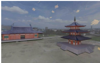
▲「百済寺跡AR」のイメージ

★「百済寺AR」の一般向けの体験会は今年で2回目だが、昨年度から内容をブラッシュアップ。タブレットを通すと朱色の2塔1金堂などが目の前に現れ、その大きさを体感できるだけでなく、天候や季節を変えたり視点を地上から空中まで上昇させたりすることができる。そのほか、再整備事業の進捗状況についての説明を行う。