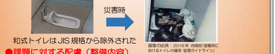
和式トイレはJIS規格から除外された

● 主な課題 (出典：内閣府「避難所におけるトイレの確保・管理ガイドライン」) ・和式トイレ：足腰の弱い高齢者等や車いすでは使用が非常に困難、不衛生 ・災害時に必要なトイレの個数の確保