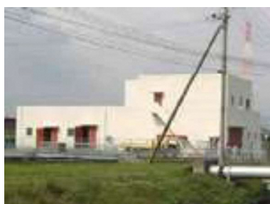
出口汚水中継ポンプ場(出口6丁目)