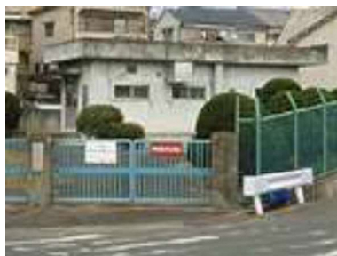
長尾家具町汚水中継ポンプ場(長尾家具町4丁目)