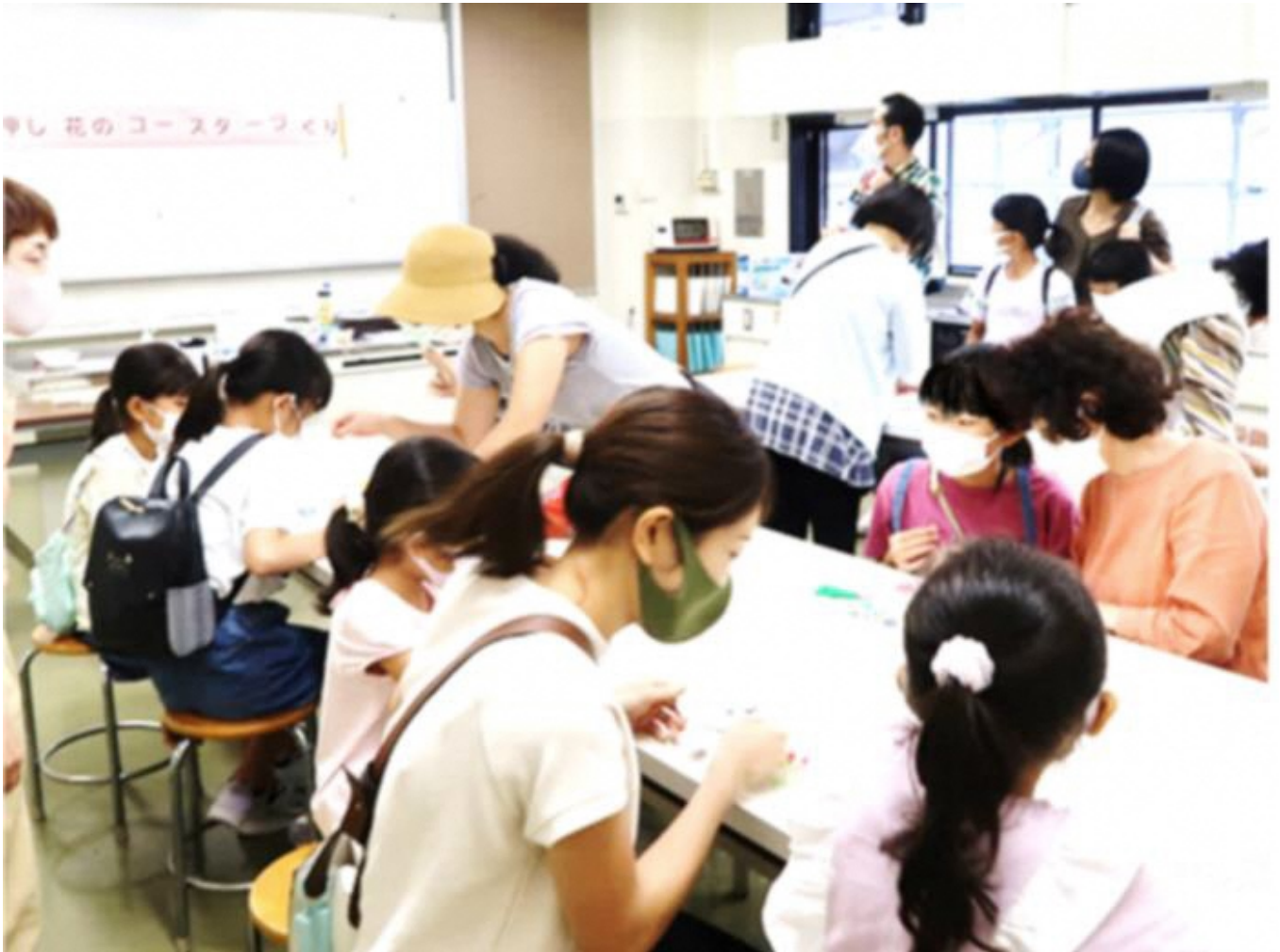
9月24日(土) 青少年教室「押し花のコースターづくり」

センターだよりの名称：中学生や高校生がやってみたいことを創り上げる場所として工場（FACTORY）をイメージしています。