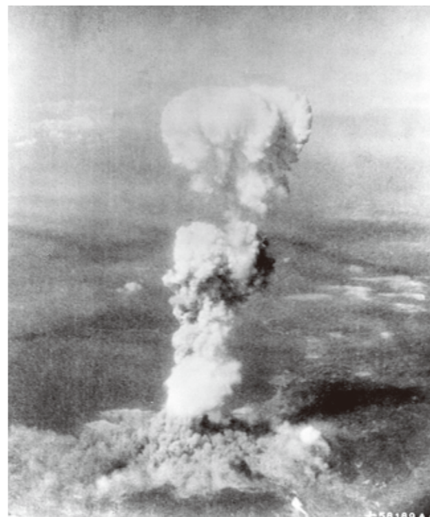
被爆直後のきのこ雲全景（航空写真）

核兵器は、ウランやプルトニウムの核分裂反応を使った、すさまじい破壊力を持つ爆弾です。爆発によって一度に大量の人間を殺すだけでなく、周囲に強い放射線を出します。その場は生き延びても、被ばくによって、がんや白血病などの病気になって死ぬ人がたくさん出ます。日本は、この人類が作った史上最悪の兵器が落とされた唯一の国です。アメリカは、1945（昭和20）年8月6日に広島へ、9日には長崎へ原子爆弾（原爆）を落としました。原爆が落とされた年に、広島では約14万人、長崎では約7万4千人が亡くなりました。その後も放射線の影響でたくさんの人が死亡し、被爆者は何年経っても不安を抱え続けています。