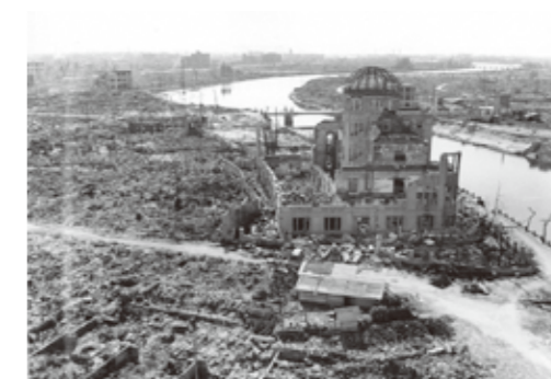
広島県産業奨励館（原爆ドーム）と爆心地付近