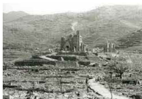
松山町の高台から浦上天主堂方面を望む