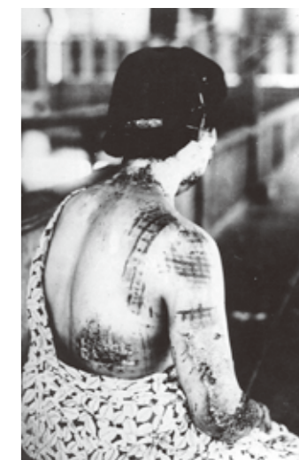
着物の模様を現している背中の熱傷