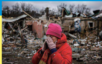
破壊した家屋の前にする人

2022(令和4)年2月、ロシアはウクライナに侵攻し、現在[2023(令和5)年3月]も続いています。ロシアのプーチン大統領は核兵器の使用を示唆するなど、国際平和が脅かされています。世界では、今も戦争や紛争で多くの人々が苦しんでいます。