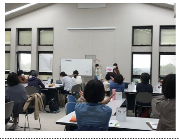
オリエンテーションの模擬授業