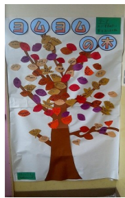
読書活動の推進 「ヨムヨムの木」(津田小)