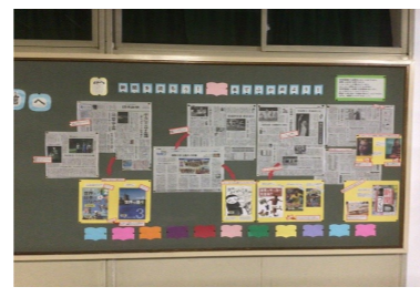
「新聞を読もう！本でふかめよう！」 新聞と本の紹介 (禁野小)