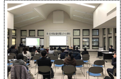
受賞者の発表の様子

11月20日に開催した朗読大会では、小中学生13人が国語の教科書から選んだ作品をしっかりと声で朗読してくれました。