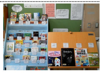
ビブリオバトル(図書委員会)で 紹介された本 (春日小)