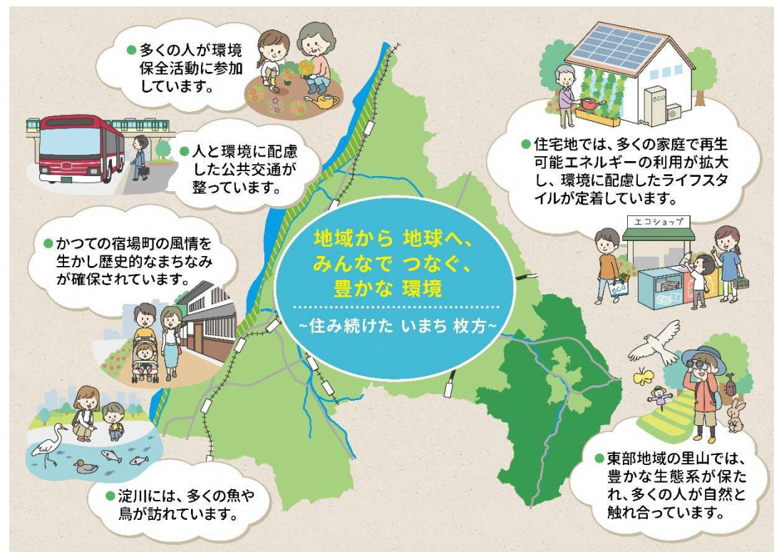
図 わたしたちがめざす将来の環境の姿