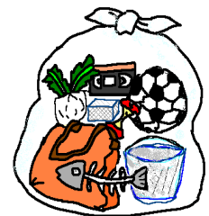
4.5リットル以下のポリ袋 (無色透明・白色半透明)