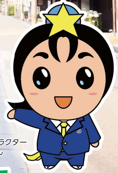
枚方市キャラクター ひこぼしくん