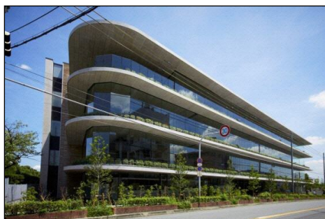
インターナショナル・コミュニケーション・センター (ICC)