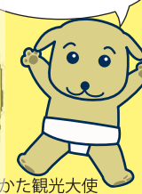
ひらかた観光大使 くらわんこ