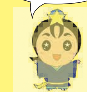
枚方市ひこぼしくん