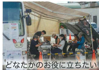
どなたかのお役に立ちたい

5月21日(日)パルコープ長尾店の協力を得て実施。初めての日曜日開催に受付55名、採血50名の協力を得られました。 今回、日曜日開催のため平日では難しい会社勤めの方などにも足を運んでもらえ、 「初めて献血しました。」と学ばれた。これからも菅原校区は減少傾向にある献血運動に貢献していききたいと思います。