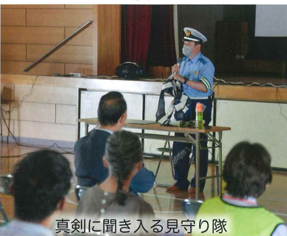
真剣に聞き入る見守り隊

5月21日(日)パルコープ長尾店の協力を得て実施。初めての日曜日開催に受付55名、採血50名の協力を得られました。 今回、日曜日開催のため平日では難しい会社勤めの方などにも足を運んでもらえ、 「初めて献血しました。」と学ばれた。これからも菅原校区は減少傾向にある献血運動に貢献していききたいと思います。