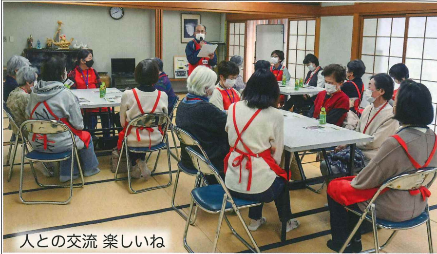
人との交流 楽しいね