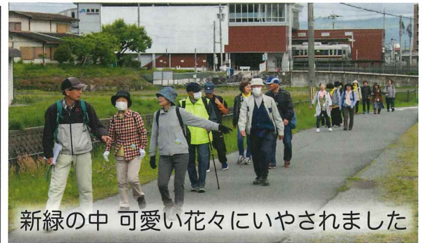
新緑の中 可愛い花々にいやされました