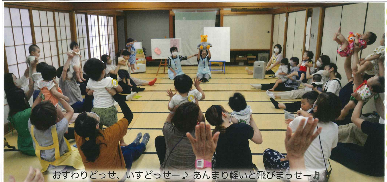
おすわりどっせ、いすどっせー♪ あんまり軽いと飛びまっせー♪