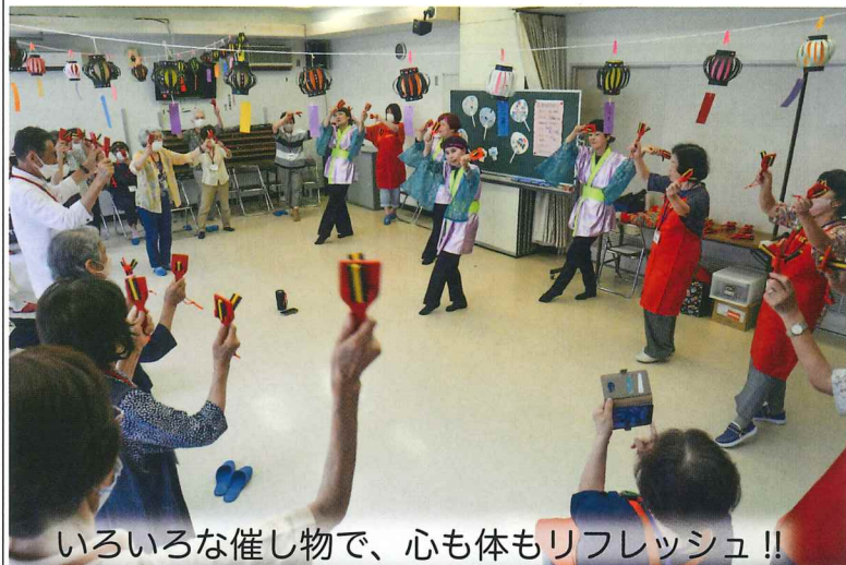
いろいろな催し物で、心も体もリフレッシュ!!