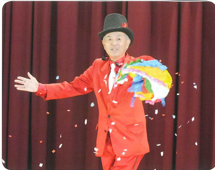
鮮やかな手さばきのダンディさんのマジックショー