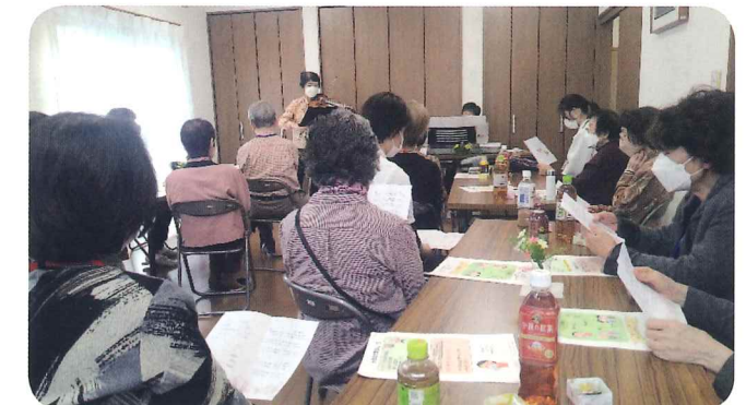
ヴァイオリンとキーボードの演奏にゆったり♪