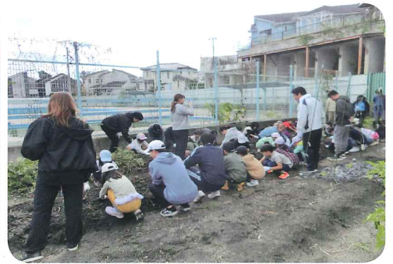
いよいよ楽しみにしていた芋掘りです