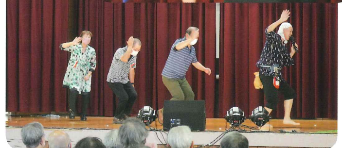
観客もどじょうすくいの体験で舞台一周、お疲れ様