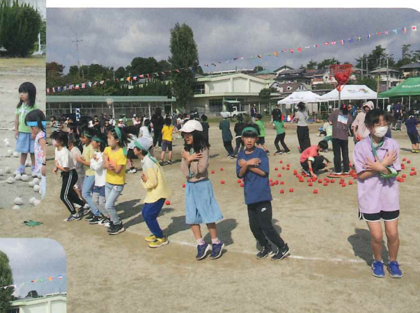
小学生は、チェッチェッコリ〜♪ 「結構体力使ったけど、楽しかった」