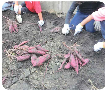
太い芋、細い芋いろいろでした