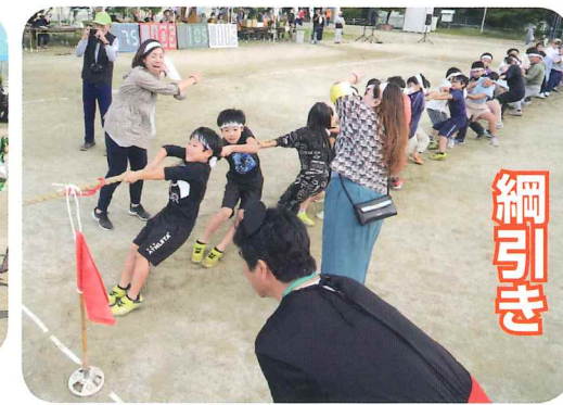
応援のお母さんたちも力が入ります