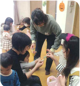
「トリック オア トリート！」 お菓子をたくさんもらいました

10月22日(水)香里ケ丘図書館多目的室にて子育てサロン「つくしんぼ」を開催しました。かぼちゃやおバケで飾られた会場に8組の親子が集まりました。ふれあい遊び、リズム遊び、積み木を積んだり、おままごとをしたり、みんなで楽しい時間を過ごしました。 10月はハロウィンの月です。紙コップにシールをぺったん。ママと協力してバケツ型のバスケットを作りました。「トリック オア トリート」ママと一緒に部屋を歩いたら、手作りバスケットがおり、みんなで楽しめました。 次回の「つくしんぼ」は12月19日(火)です。い子にしてると、サンタさんに会えるかも？