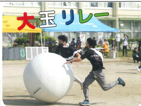
白のアンカーは高校生兄弟 「小学生以来の参加で緊張しました」