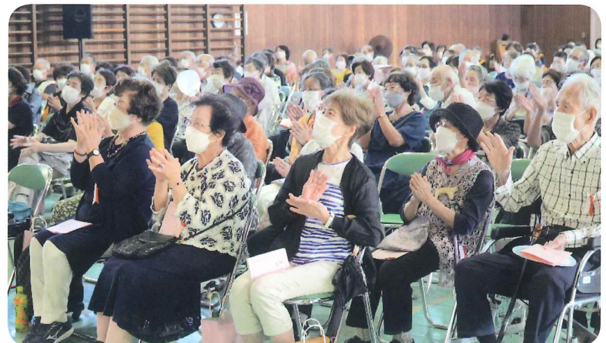
見事な演技に思わず拍手喝采 元気をたくさんもらいました

・フラダンスは、楽しいし、お年寄りも喜んでもらえて気持ちが良いです。敬老のつどいは、続けてもらいたい。 (4丁目女性) ・フラダンスを娘といっしょに習ってみたくなりました。(スタッフ女性) ・川北さんの歌、とても感動しました。スタッフが、朝早くから来られて頑張っている姿に私も励まされました。(防犯 男性)