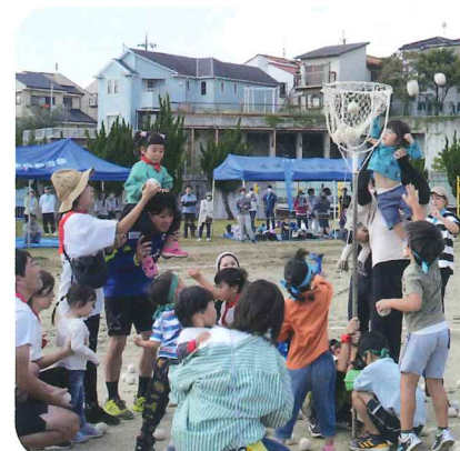
ババの肩車でたくさん入った