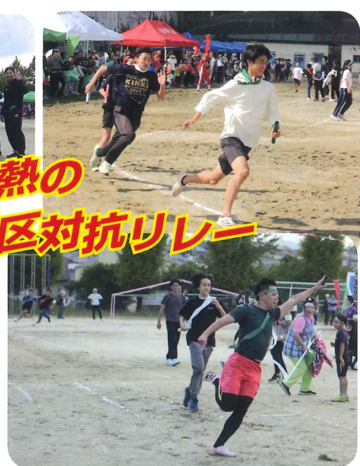
リレーは、ゴール直前で緑が逆転勝利