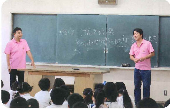
けんぎゅう祭実行委員長が熱い思いを伝えました

どのようにして「けんぎゅう祭」 を始めたのか、そのときの苦労話 や、今まで続けてきた中で大変 だったこと、また、嬉しかったこ となどを話しました。楽しい祭り もいろいろな方の協力で成り立っ