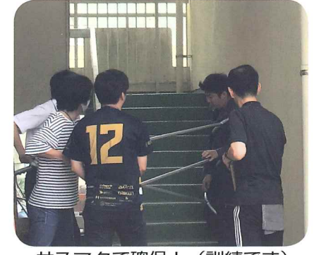
サスマタで確保！（訓練です）

9月22日(金)香陽小学校では、不審者侵入に対する訓練を実施しました。 午前は児童を対象に授業中に不審者が入ってきたという設定での訓練です。児童は、教室のドア