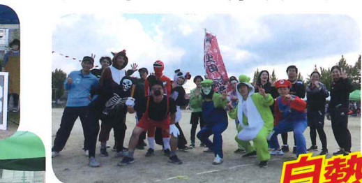
今年も走った変身チーム