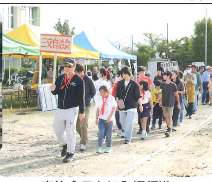
自治会ごとに入場行進