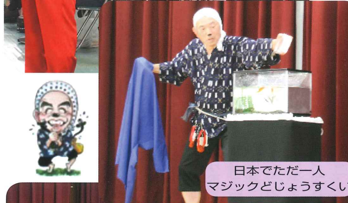
日本でただ一人マジックどじょうすくい