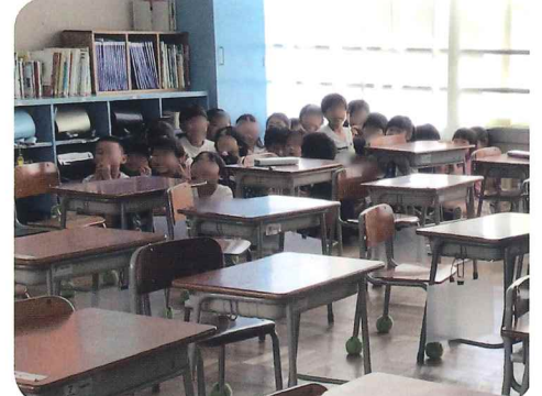
子どもたちも真剣に訓練