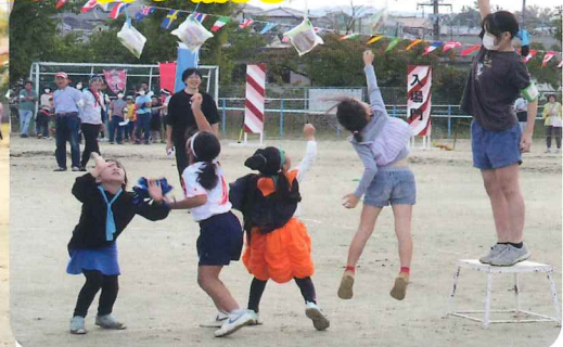
感染対策のため手で掴む「パン取り」に。 「全力でくらいついた！」小4女子