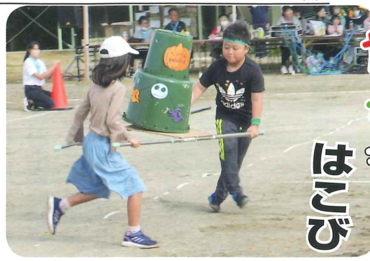
バランスが難しい。慎重に、慎重に