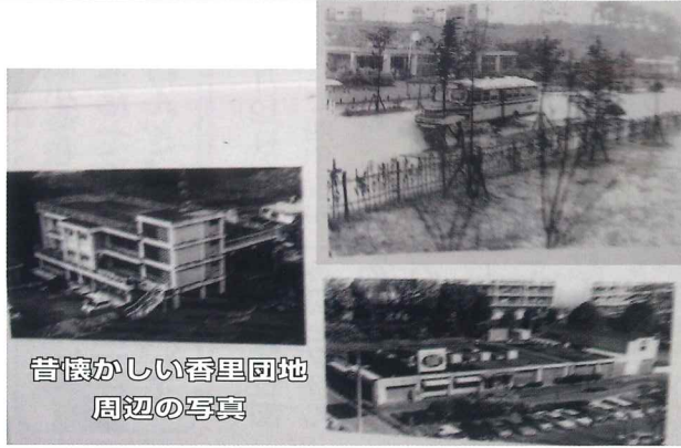
昔懐かしい香里団地 周辺の写真