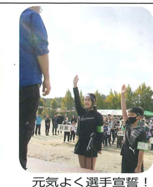
元気よく選手宣誓！ (ジュニアリーダー代表)