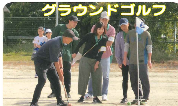
地面がぬかるんでいて、打つの難しい〜 「おっと、入ったか？どっちだ!？」