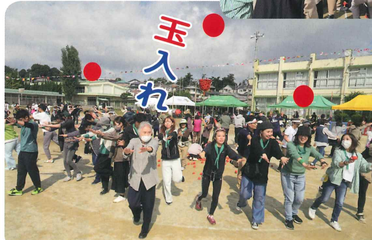
中学生・一般の玉入れは、パタリロのクックロビン音頭で。紅も白もダンスはバッチリ。足がつりそうになった人も。