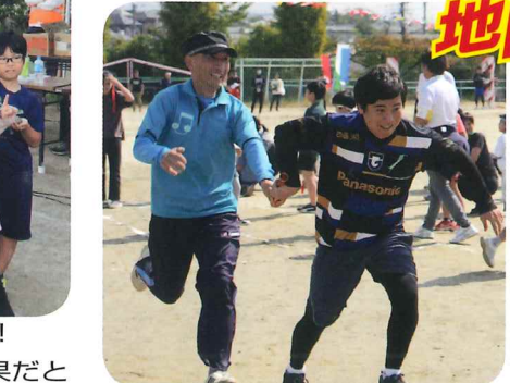
先生チームも本気で爆走！