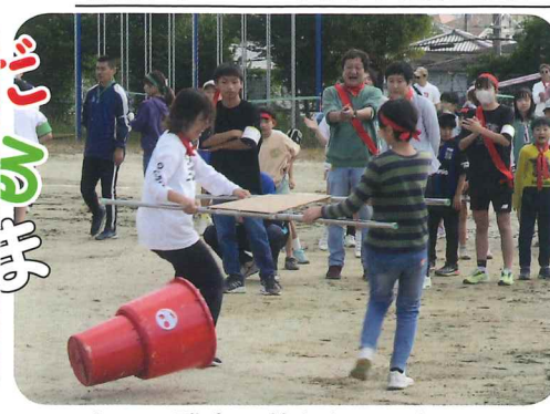
あ〜、残念、落ちちゃった！