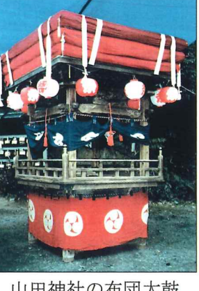
山田神社の布団太鼓

井屋が、東のお寺のその寺で七ツ道具を背なにおいで五条の大橋の真ん中でエーラエーラエラサッサほたんに唐獅子竹に虎虎追て走るはわとうないにわとないお方に知恵がそか知恵の中山せいかん寺せいかん寺の和尚さん坊さんで坊さんたこくてへそついてその手でお釈迦の顔なでてお釈迦がいやに飛んで出たサッサー(山之上版) 布団太鼓はやし歌