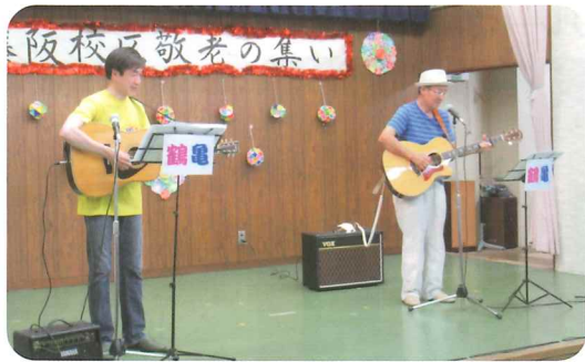
ご長寿お祝いバンド鶴亀