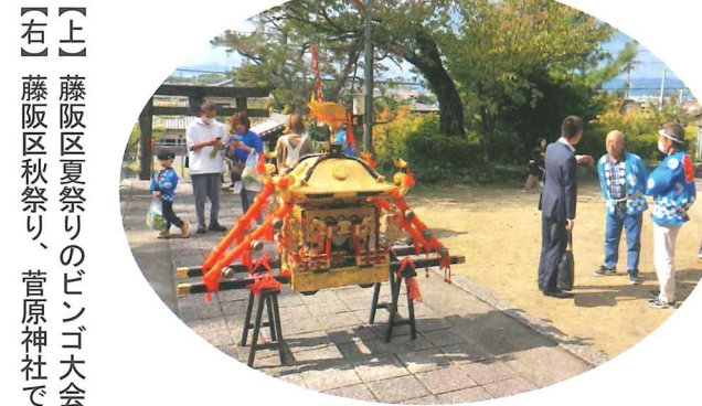
【上】藤阪区夏祭りのビンゴ大会 【右】藤阪区秋祭り、菅原神社で

藤阪区夏祭り カラオケと ビンゴで楽しく 3年間開催を見送って いた夏祭りを8月11日(土)