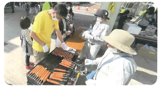
フランクフルトの売店