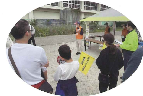
田口山校区自主防から受け入れの説明

いるものの、低地にあるために、枚方市防災ガイド「穂谷川洪水ハザードマップ」では豪雨時に浸水被害に遭う危険性がある