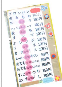
大盛況!チケットもほぼ売り切れ

晴天に恵まれた11月4日(土)4年ぶりとなる「藤小校区まつり」を、校区コミュニティ協議会とPTAとの共催で、藤阪小学校で開催しました。会場では、PTAによる「あてもの」や「お菓子つり」などの模擬店、おやじの会による「ゲームコーナー」、藤阪スポーツ少年団による「ストラックアウト」、藤小教職員による「スタンプラリー」に加え、小学校東側のてらしま歯科が「歯ブラシデコレーション」を行っていたり、各方面から多大な協力をいただき、大いに盛り上がりました。コミュニティ協議会は、「蒸し芋」400個と「フランクフルト」400本の無料配布を行いました。まつりの最後を飾る「お楽しみ抽選会」では、景品として例年と同様の「図書券」に加え、災害発生時に役に立つ「防災グッズ15点セット」を今回初めて用意し、防災に関する啓発を図りました。