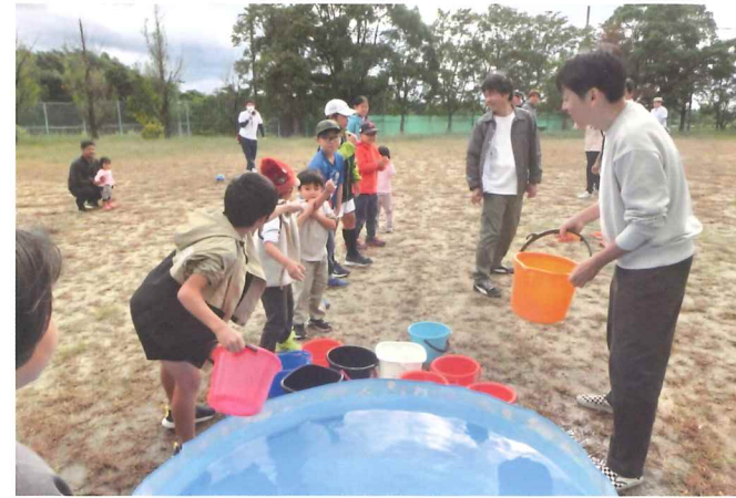
バケツリレーによる消火訓練