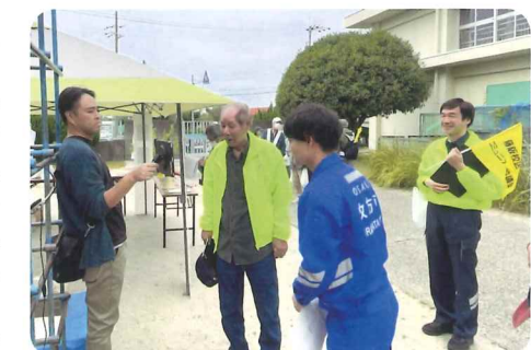
市災害対策本部長の伏見市長と通信