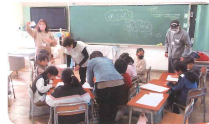
紙てっぼう・紙ふうせん

楽しく体験しました。子どもたちは「けん玉むずかしい」「紙てっぼうは音が出て面白い」などと言