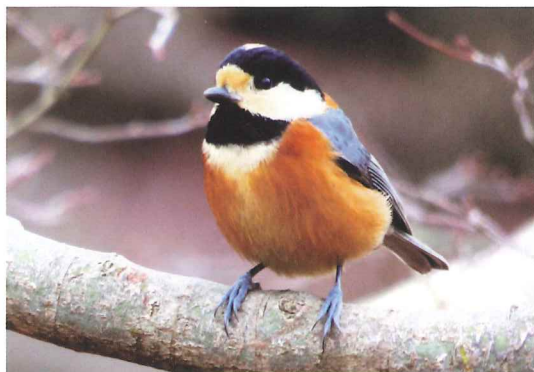
山田池公園のヤマガラも人懐っこい