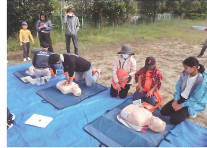
いざというときに救急救命講習

10月21日(日)、めましました。アウトドアに防 藤阪天神町自 災訓練の要素をプラスする 治会が発足し ことで将来の備えにもつな がりを、かつ楽しさも持ち合 わせることで、自治会住民 間のコミュニケーション、 ネットワークの構築などの 機会としても非常に有用で あると考えました。 午前中は、救急救命講習 と水消火器を使用した消火 訓練を行い、備蓄食 品(アルファ化米炊 き込みご飯) 試食や 豚汁などの炊き出し の昼食を挟んで、午