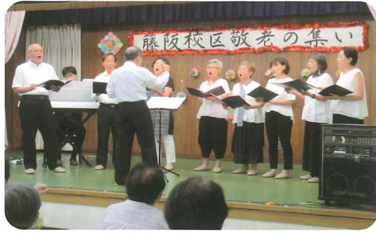
わいわいエチュード コーラス