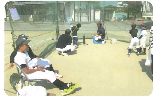
ティーバッテング