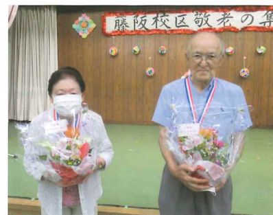
盛り花とメダルでご長寿をお祝い

た中で、6グループが演技を披露。中でも、三歳児を交えたチアダンスは高齢者の注目の的でした。また、施設「ワーク草笛」のダンスには大きな声援が上がりました。出演者からは、「久しぶりに大勢の観客の前で舞台上がれてよかった」とのコメントもありました。