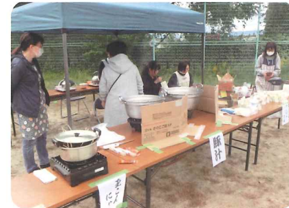
アルファ化米や豚汁など炊き出し訓練