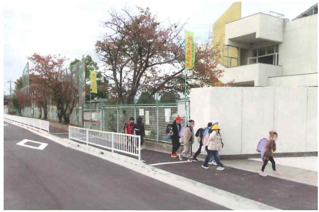
校庭東側の通路路、フェンスができて安全に