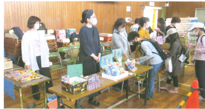
おもちゃのあてものコーナーも人気