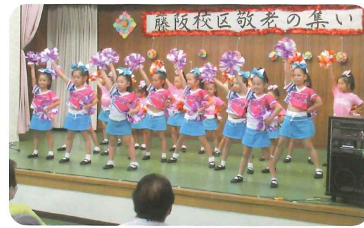
わいわいエチュード コーラス