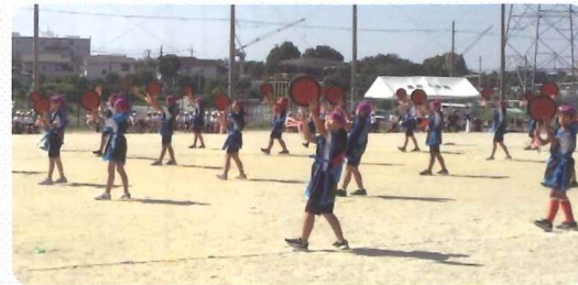
5年「ピースクルエイサー」

9月30日(土)すばらしい秋空のもと、第43回藤阪小学校運動会を開催し、無事大成功に終わりました。今年の児童会が決めたスローガンは「新たな挑戦(チャレンジ)に根性出して立ち向かう!」でした。コロナは一時の勢いはないものの、インフルエンザとともに徐々に感染者が増加傾向にある中、まだ続いていた残暑と対峙しながら、子どもたちは今できる最大限の事を一生懸命がんばりました。