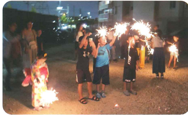
リバーサイド南の夏祭り、 子どもたちも花火で楽しく

藤阪区秋祭り 子ども神輿は なかったけれど 神社での神輿(みこし) の展示と法被を貸与しての 神輿との記念撮影会を、婦 人会、秋祭り実行委員会、 菅原神社の協力のもと、10 月15日(日)に開催しまし た。 恒例の子ども神輿の巡行 は、コロナ禍の空白の中で