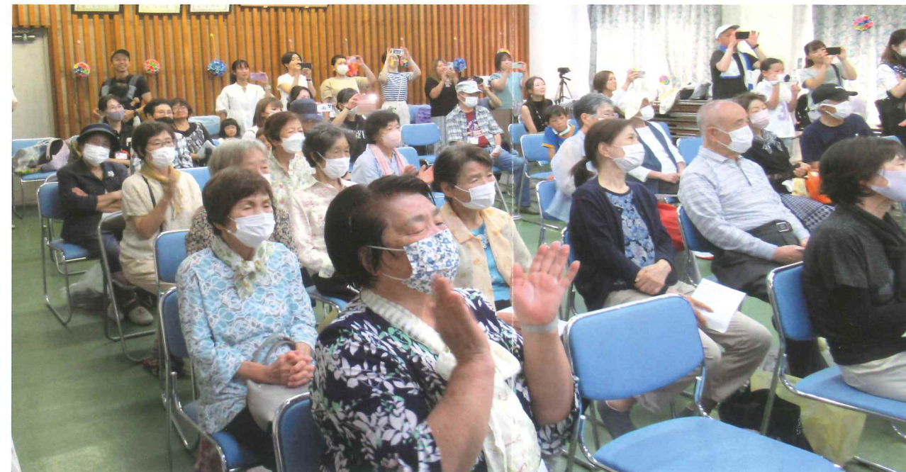
皆さんの心を込めた熱演に、会場いっばいに笑い声と拍手が広がりました