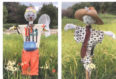
今年もしっかり登場しました

昨秋の当紙98号で紹介した山田池公園の田んぼのかかし。今年も6体の創作かかしが、しっかりと稲を守っていました。