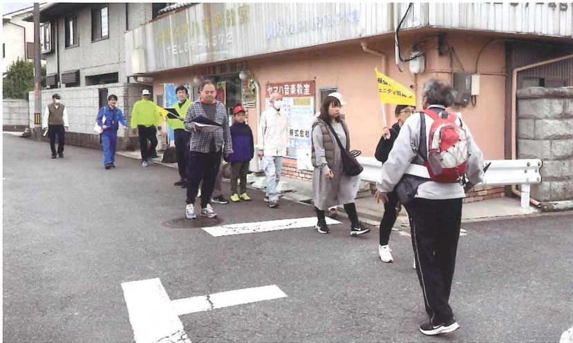
藤小から田口山小まで3コースで歩いて避難路の安全をチェック