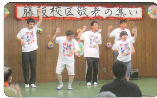
ワーク草笛 ダンス

11月23日(木)に行われた枚方社協の第2回ボッチャ大会で、藤阪校区チームが出場12チーム中、みごと準優勝という成績を収めました。