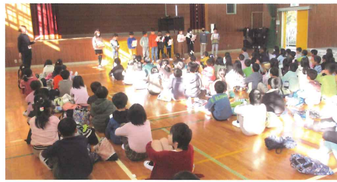
子どもたちから始まりの挨拶

子どもたちと昔ながらの遊びやモノづくりを通じてふれあう世代間交流。11月22日(水)4年ぶりに藤阪小学校で開催しました。今回は1年生と2年生の児童が、校区福祉委員会、民生児童委員、藤阪区役員、学校評議員、ボランティアグループ「ひまわり会」の皆さんの手ほどきを受け、教室と体育館で紙トンボやあやとり、紙てっぼう、紙ふうせん、リボン結びと縄遊び、パックぽっくり、おまわりし、けん玉を