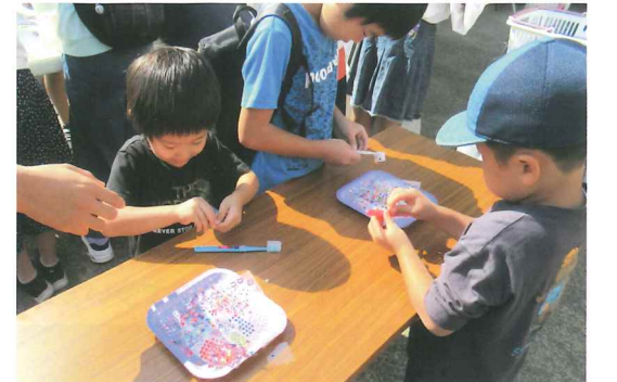
てらしま歯科による歯ブラシデコレーション