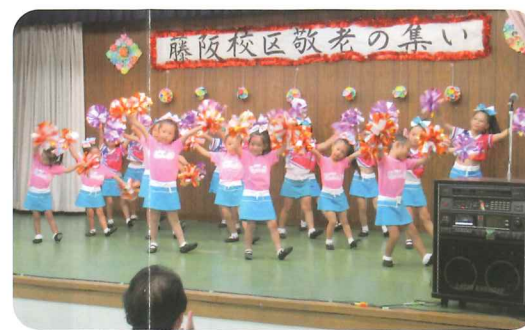
JOYチアリーダーズクラブ チアダンス