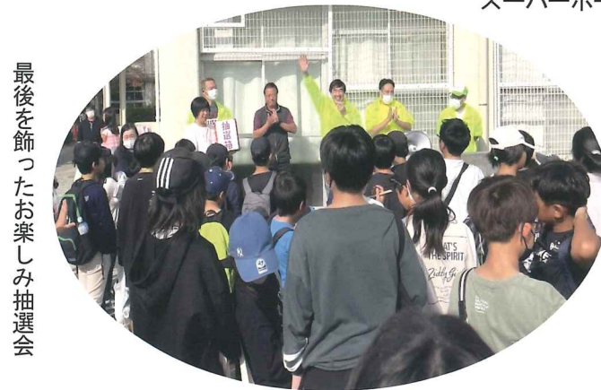
最後を飾ったお楽しみ抽選会