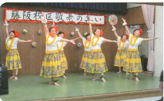
愛逢フラガール フラダンス