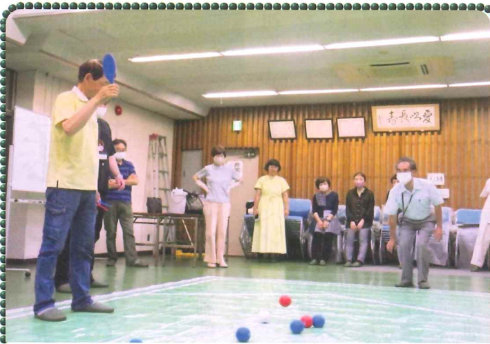
藤阪公民館で校区福祉委員会もボッチャを学習