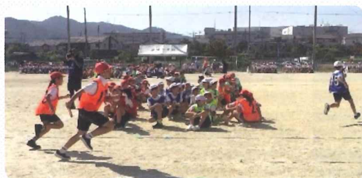
4年「走れ・つなげ・その先へ 74人の全カリレー」