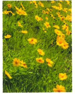
▲オオキンケイギク

同じマツヨイグサの仲間ですが、暑さに強く、日中に直径4~5cmの花を元気に咲かせています。帰化植物です。庭に植えたいほど可愛い花。