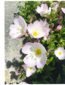
▲ヒルザキツキミソウ

夕方から咲き始め、朝にはしほむ黄色の花を咲かせます。しぼんだ花は黄色からオレンジ色になります。夕方に咲くのは受粉のために、蛾を引き付けるため、黄色は暗くなっても目立ちますよね。