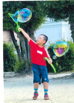
▲なが〜いしゃぼん玉