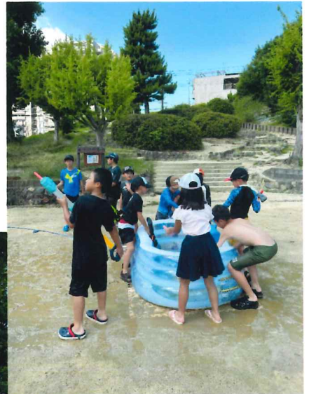
▲水てっぽうに大はしゃぎ