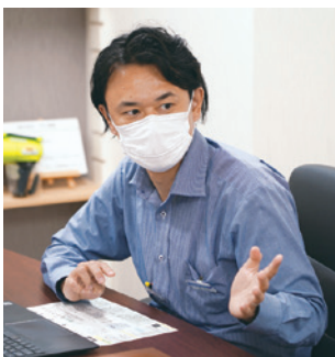
▲「健康経営で会社の体質は大きく変わった」と話す猪奥社長

働く人にとって、一日の大きな時間を占める社内環境を整えることは、非常に大切です。とは言っても、大きな予算は使えないため、ちょっとした工夫でできることから、経営者視点・従業員視点のアイデアを取り入れ、積み上げていきました。