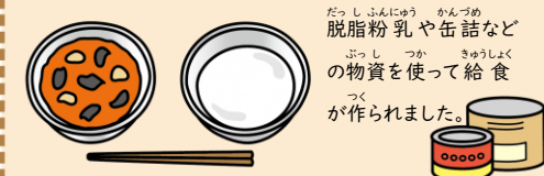
トマトシチュー・ミルク