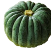
にほん 日本かぼちゃ

西洋かぼちゃに比べ、甘さが控えめで水分が多く、ねっとりとしています。煮崩れしにくいので煮物に向いています。