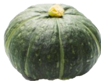
せいやう 西洋かぼちゃ

スーパーなどで売られているかぼちゃのほとんどは西洋かぼちゃです。ホクホクとした食感や甘みが特徴です。