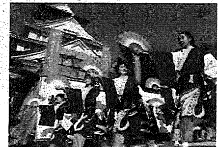
大阪メチャハッピー祭 in 大阪城