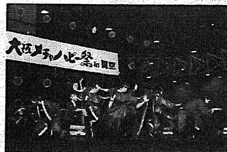
大阪メチャハッピー祭 in 関空